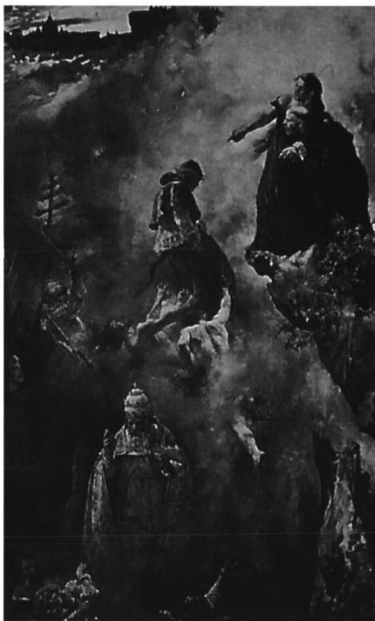
La visión de Fray Martín. Tríptico, dibujo a la gouache.