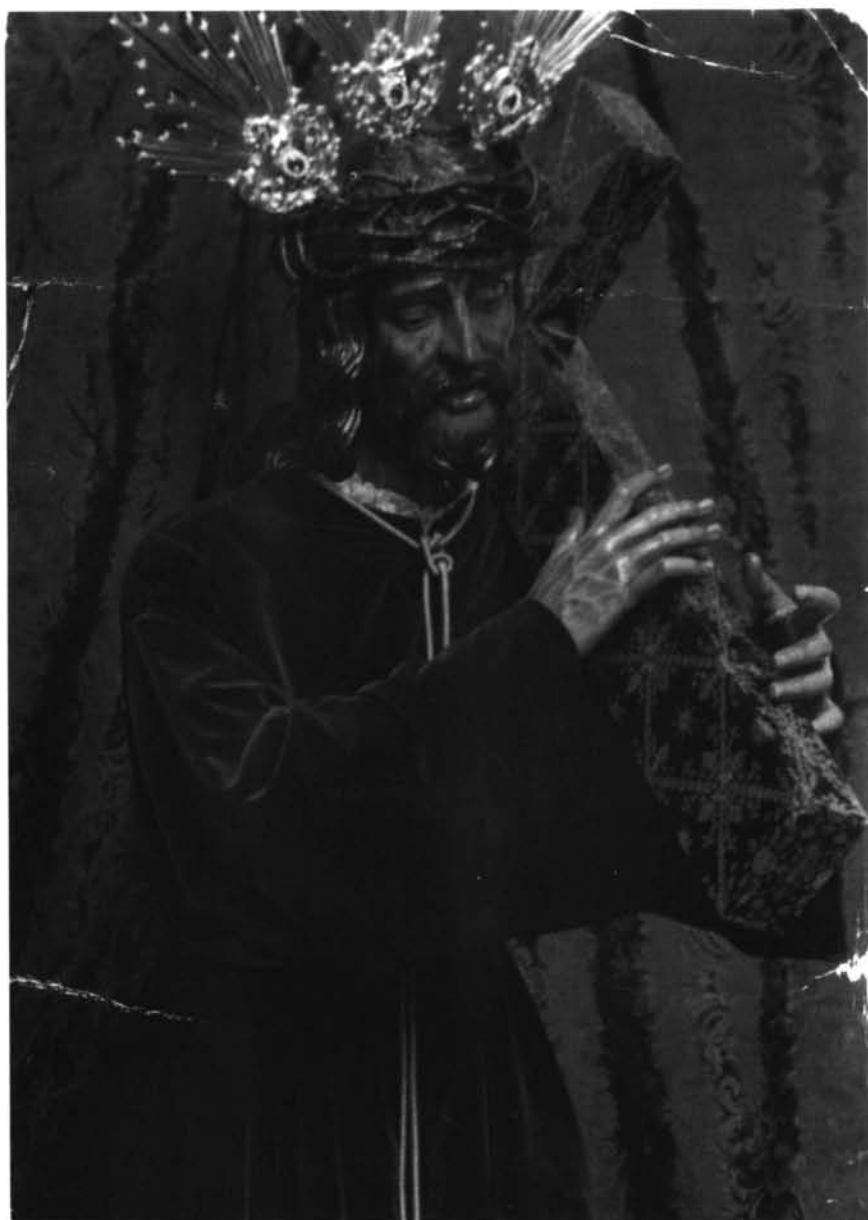
Lám. 4. N.P. Jesús Nazareno. Iglesia de San Juan Bautista. Ecija.