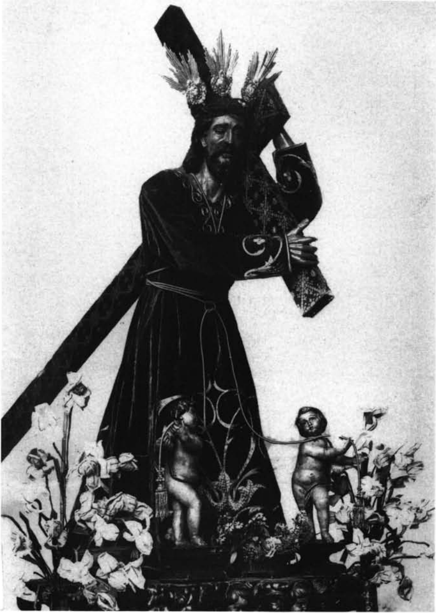
Lám. 3. N.P. Jesús Nazareno. Iglesia de San Juan Bautista. Ecija.