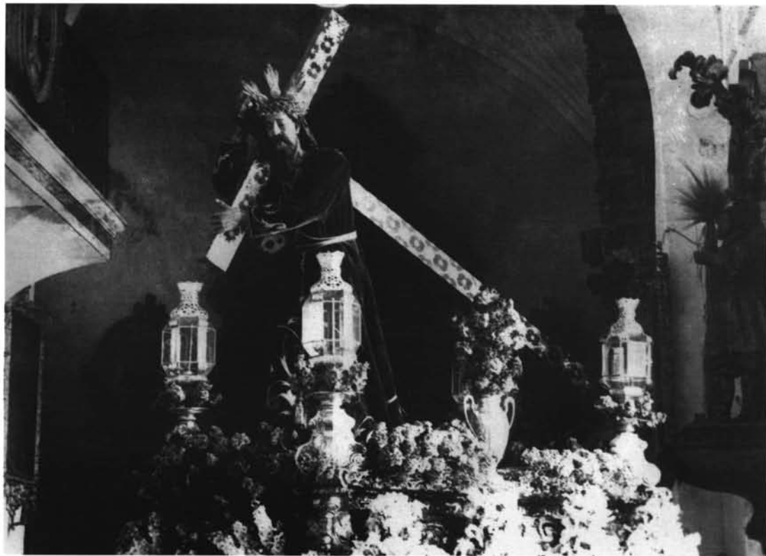
Lám. 5. Retablo cerámico. 1962. Plazuela de San Juan. Ecija.