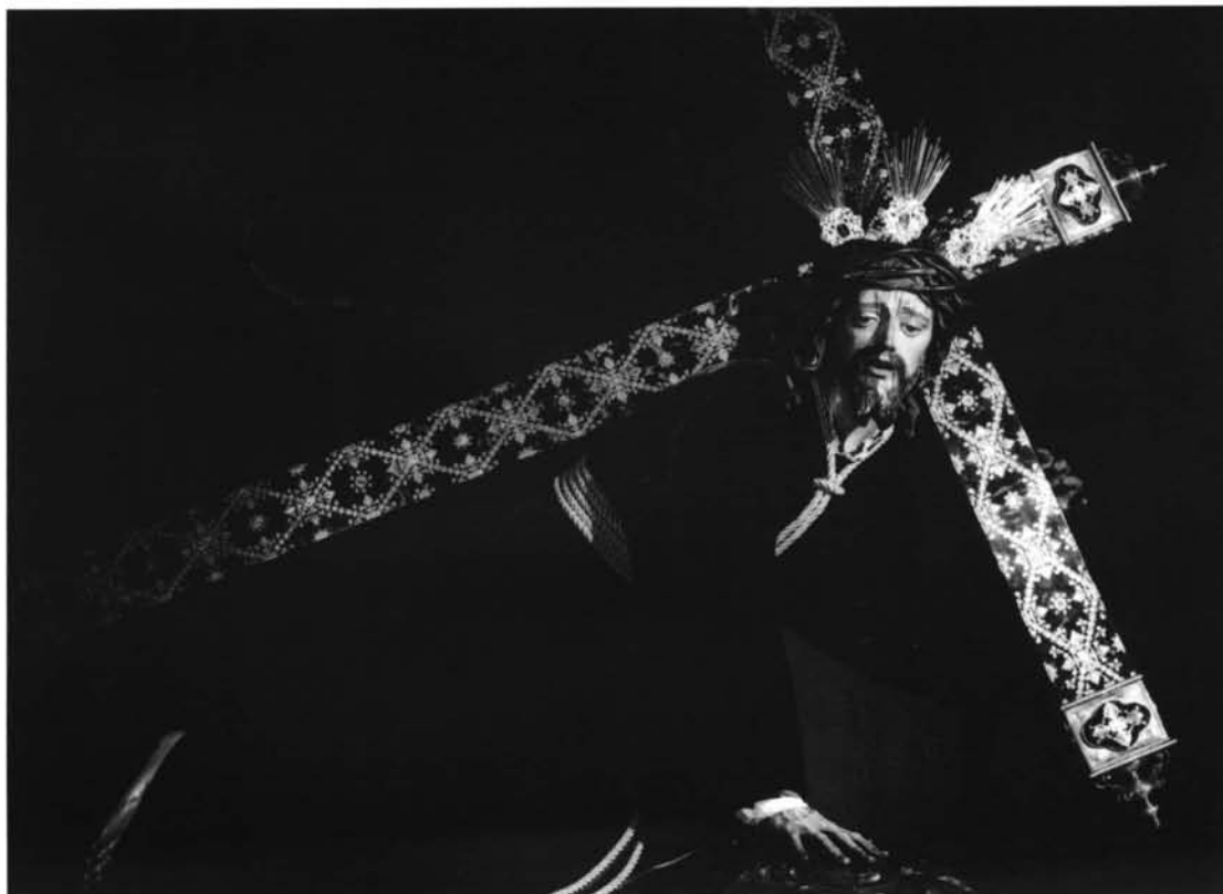
Lám. 2. N.P. Jesús de las Penas. Iglesia de San Vicente Mártir. Sevilla.