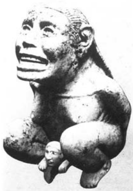
La diosa del parto: Tlazoltecd-Ixmina. Col. Bumer, Nueva York.