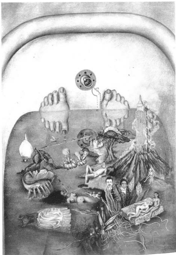
"Lo que el agua me ha dado". Col. particular. México, 1939.