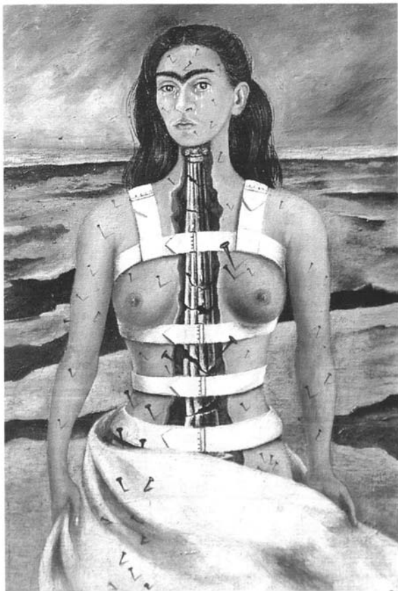
"La Columna Keta". Col. Dolores Olmedo, México, 1944.