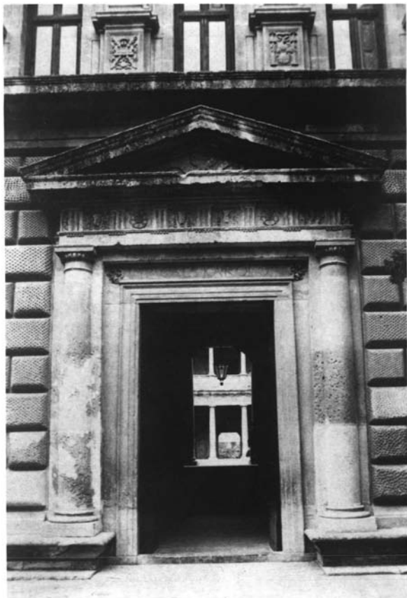
Granada. Palacio de Carlos V. Portada oriental.