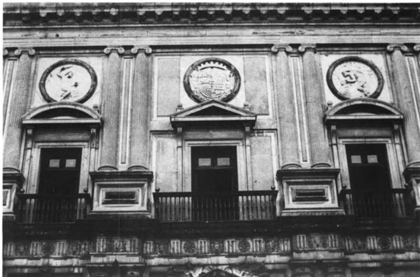
Granada. Palacio de Carlos V. Portada occidental. Segundo cuerpo.