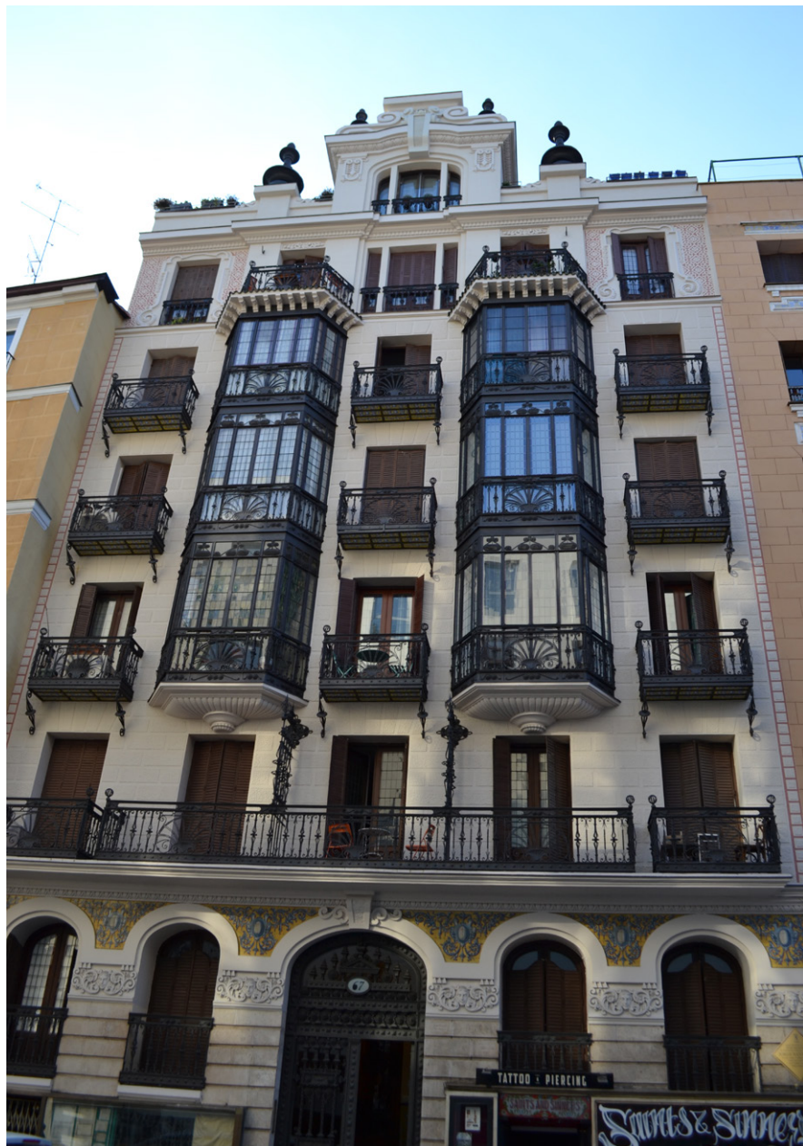
Figura 5. José Antonio de Ágreda (arquitecto), Edificio de viviendas, calle San Bernardo 67 , hacia 1925, Madrid.