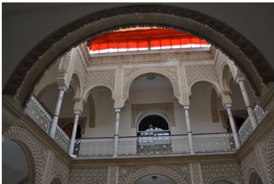
Figura 2. Patio neomudéjar , Colegio Compañía de María (antes Casa de Ágreda), hacia 1858, Jerez de la Frontera.