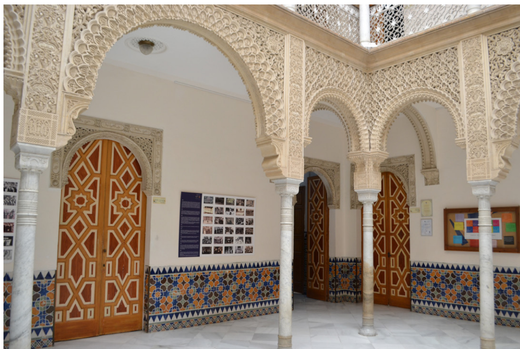
Figura 3. Patio neomudéjar , Colegio Compañía de María (antes Casa de Ágreda), hacia 1858, Jerez de la Frontera.