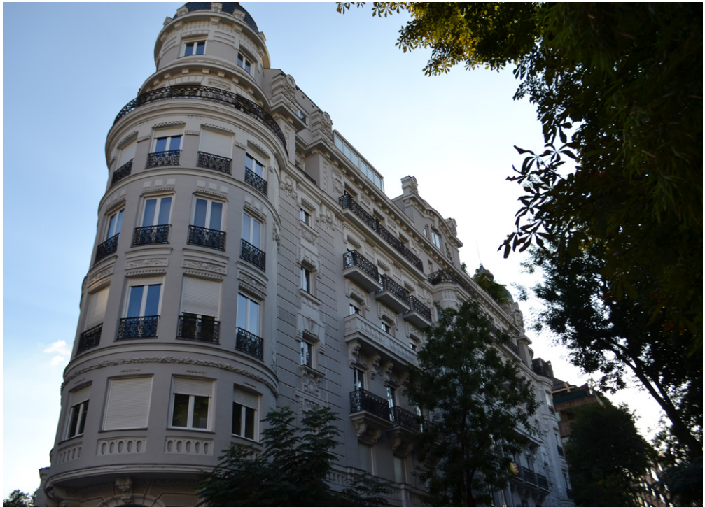
Figura 4. José Antonio de Ágreda (arquitecto), Edificio de viviendas, calle Almagro 15 , hacia 1916, Madrid. Foto: Myriam Ferreira Fernández.