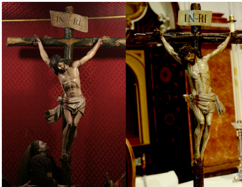
Figura 4. Foto comparativa de los Crucificados de la iglesia de los Desamparados de Sanlúcar de Barrameda (Cádiz) y de las Descalzas de Cádiz.