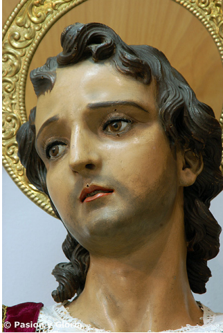
Figura 6. San Juan Evangelista , iglesia de la Pastora, Cádiz.