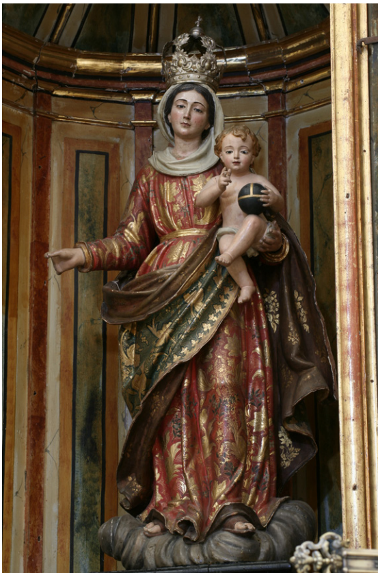
Figura 7. Virgen con el Niño , iglesia de San Jorge, Alcalá de los Gazules (Cádiz).