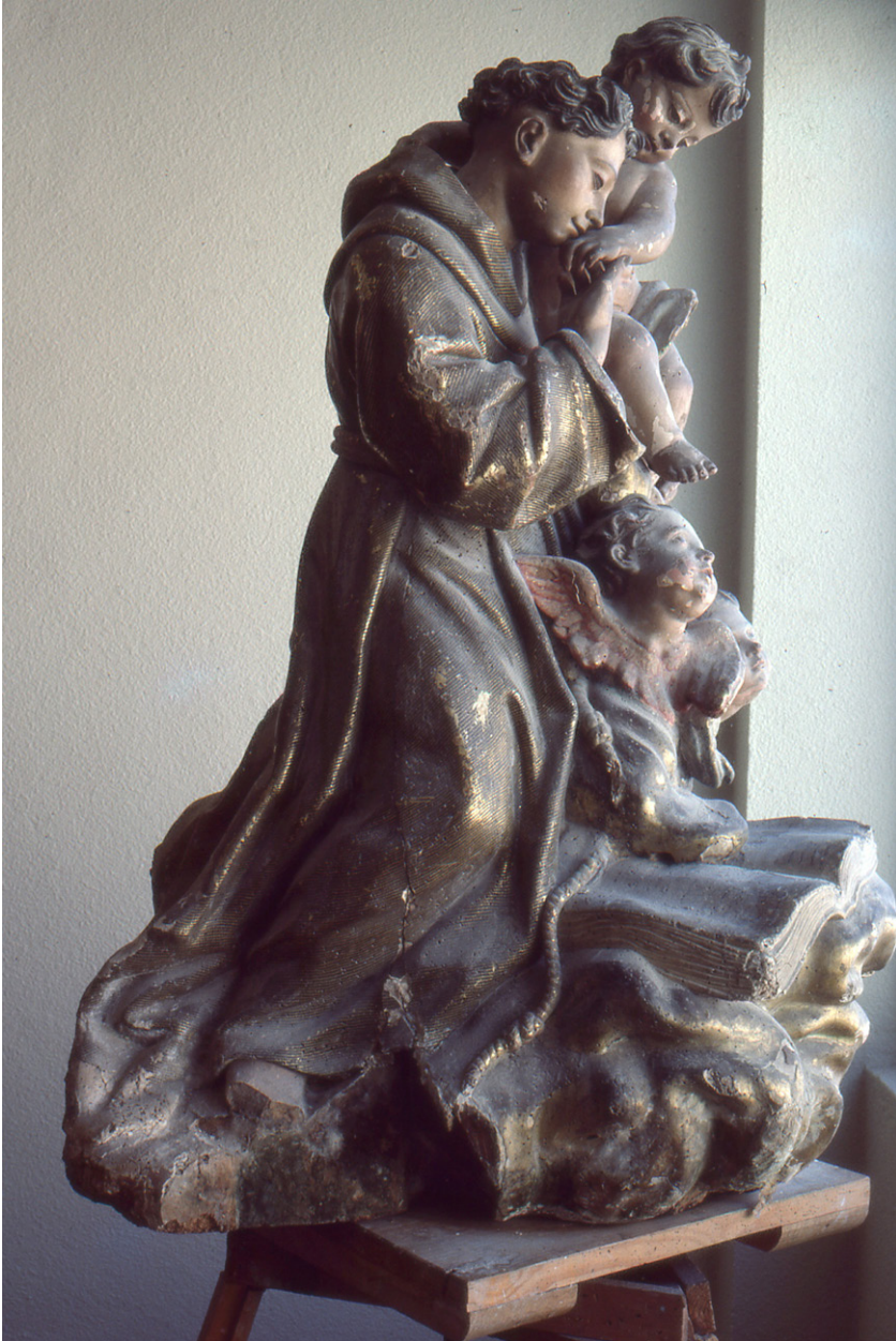
Figura 3. San Antonio de Padua , catedral de Cádiz.