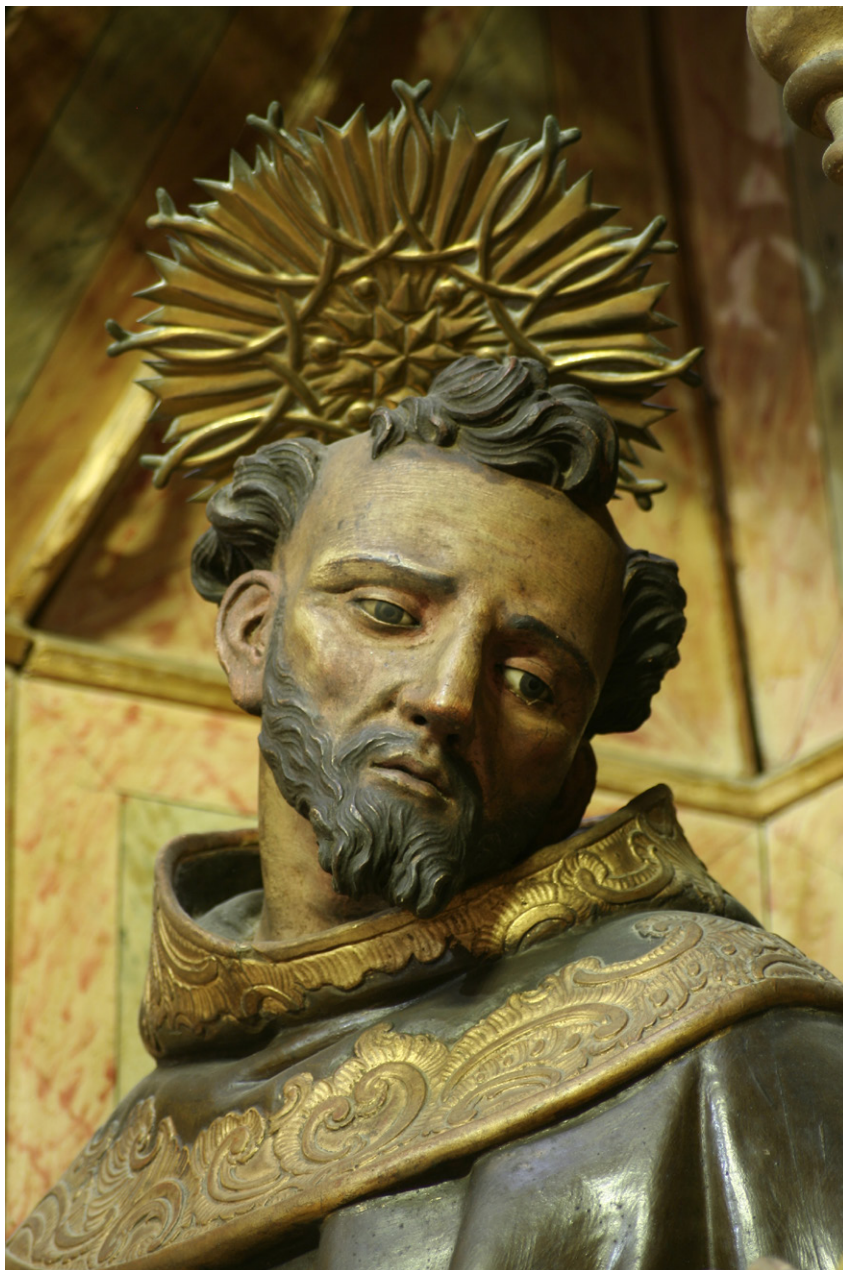
Figura 1. San Francisco de Asís , iglesia de San Mateo, Tarifa (Cádiz).