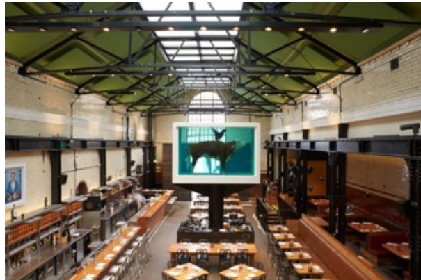
Figura 04: Cock and Bull. Damien Hirst (2012)

Damien Hirst ha llevado a cabo una estrategia similar al donar Flame Grilled , una de sus spin paintings , a un restaurante Burger King en 2012. Esto corresponde a los Juegos Olímpicos que se llevaron a cabo en Londres ese mismo año. La ubicación del local era en Leicester Square , una zona muy concurrida. De la misma forma, buscaba atraer clientela mediante su obra. Las actuaciones, tanto de Hix como de Hirst, responden a una mentalidad empresarial en que utilizan la fama del artista, en forma de obra, para acercar al cliente al establecimiento. A la par, impera la sensación de lujo y estatus, mediante la pieza y su creador. Los valores asociados a la obra y la marca Hirst permean desde el objeto al local, convirtiendo a esta en una inversión derivada del capital simbólico.