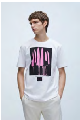
Figuras 01, 02 y 03: Camisetas Andy Warhol Zara basadas en Knives (pink and black) (1981-1982), Skull Series (1928- 1987) y firma oficial de Any Warhol