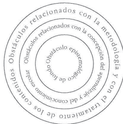
Fig. 2. Manifestaciones de diversa profundidad en los obstáculos de alumnos y profesores.

de ahí habría que acceder a otra capa más profunda, los obstáculos relativos a la concepción del aprendizaje y del conocimiento escolar; por fin, se trataría de llegar al núcleo más duro y resistente, que constituye el obstáculo epistemológico de fondo: las creencias sobre la naturaleza del conocimiento (Porlán, García y Rivero, 1994).