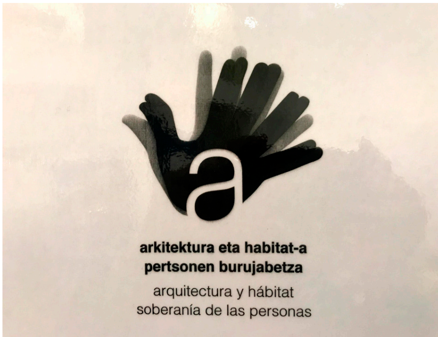
Figura 1: Fotografía de logotipo del Congreso Arcadia5 diseñado por IDk ( http://www.liquiddinamik.liquidmaps.org ).

En el módulo 2, la discusión giró en torno al medio humano, cuyo reto perseguía afrontar las consecuencias de una globalización que conduce a la pérdida de la identidad cultural de cada territorio y en el que se propuso dirigir las contribuciones hacia la recuperación y fortalecimiento de estas identidades.