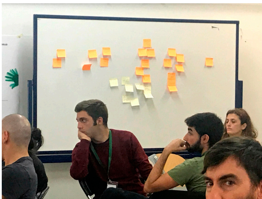
Figura 5: Otra las conversaciones world café.

11 Doctor Ingeniero químico y profesor contratado doctor de la Universidad Jaume I con una dilatada trayectoria en el mundo de la Química. Es autor de más de 45 publicaciones científicas en revistas internacionales y más de 60 aportaciones a congresos, varios capítulos de libro, dos patentes y co-fundador de una spin-off (Nanobiomatters S.L.). Además, coordina el Grupo de Innovación Educativa en Ciencia de los Materiales (GIE-CEM) y su labor en la innovación educativa se centra en el aprendizaje basado en proyectos y el aprendizaje-servicio (Service Learning).