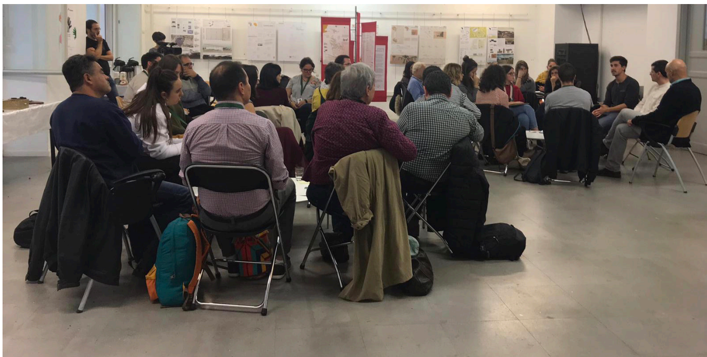
Figura 4: Una de las conversaciones world café que tuvieron lugar en Arca-dia5.

En el segundo, el módulo “Entorno Humano”, se trató el derecho al habitar y el derecho a la movilidad, el compromiso a largo plazo de todas las personas implicadas en el desarrollo de proyectos de cooperación, la reciprocidad existente entre las personas que se relacionan en proyectos de este tipo y, por ello, se recalcó la importancia de la escucha y la empatía necesarias para abordar estos proyectos.