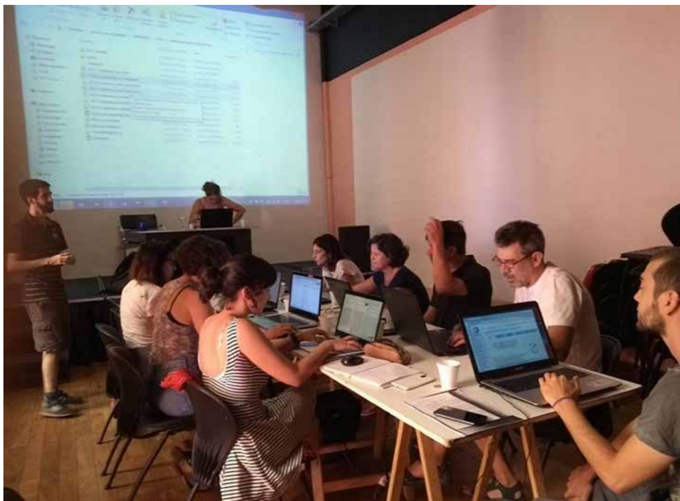
Figura 5: Editatona en el Centro Cultural España-Córdoba, organizada por el GrupoMujj(lh)eres Latinoamericanas.

Si bien existe una resistencia de algunos usuarios de mayor antigüedad, la Fundación Wikimedia está sumamente abierta a avanzar en este sentido y financia estas y otras iniciativas. Otras instituciones también han sumado su apoyo como la Facultad de Arquitectura, Diseño y Urbanismo de la Universidad Nacional de Buenos Aires, la Facultad de Arquitectura, Planeamiento y Diseño de la Universidad Nacional de Rosario, la Facultad de Arquitectura, Urbanismo y Diseño de la Universidad Nacional de Córdoba, el Consejo Profesional de Arquitectura y Urbanismo, el Colegio de Arquitectos de la Provincia de Santa Fe y el de la Provincia de Buenos Aires, los Centros de Cooperación de España en América Latina. Así mismo las actividades cuentan con el aval del Gender Hub de UN Habitat (ONU).