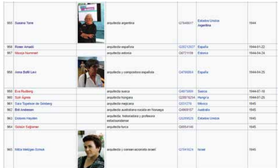
Figura 2: Captura de pantalla de línea de tiempo de arquitectas generada con Wikidata. Fuente: Elaboración propia.