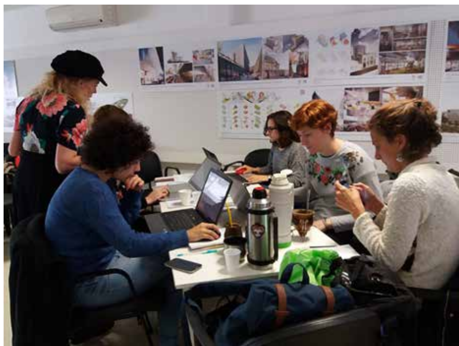
Figura 4: Editatona en el Colegio de Arquitectos de Santa Fe, organizada por el GrupoMuj(lh)eres Latinoamericanas.