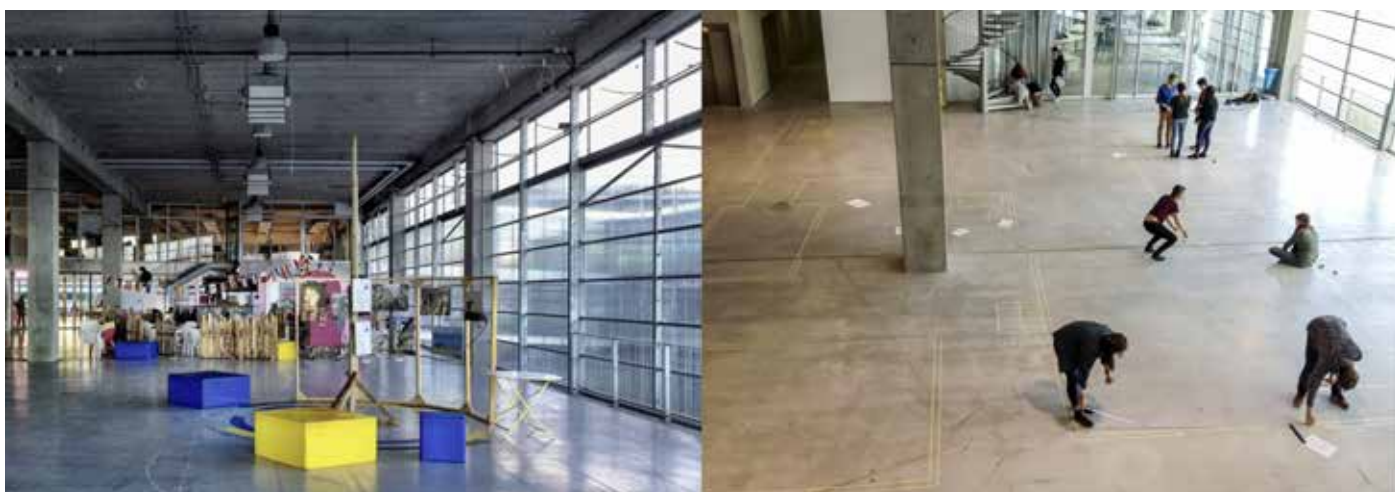
Figura 6: Planta baja de la ENSA Nantes.

Duplicar el espacio sin acrecentar el presupuesto es el primero de sus lemas. Espacio que, perfectamente definido en su construcción, goza de la indefinición funcional que lo hace apto para un futuro incierto y abierto a la innovación. Digamos de paso que esa inclinación de la arquitectura hacia la ingeniería es característica de un modo muy francés (muy racional) de ver la arquitectura.