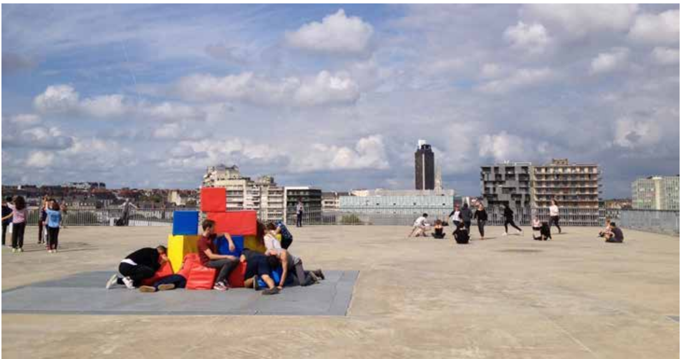
Figura 5: Cubierta de la ENSA Nantes.

Son dos modos opuestos de concebir el espacio de la arquitectura los que manifiestan ambas escuelas: el uno es convergente y centrípeto (Alicante) y el otro divergente y centrífugo (Nantes). En el primero, el espacio alrededor se introduce y penetra hasta el último rincón del edificio. En el segundo, es el espacio interior, previamente alojado en una firme macroestructura, el que se provee de una porción extra (cfr. Ruby y Ruby, 2007b, pp. 6-7), que duplica lo necesario y revienta , por así decirlo, el programa en previsión de un futuro siempre incierto ( Figura 5 ).