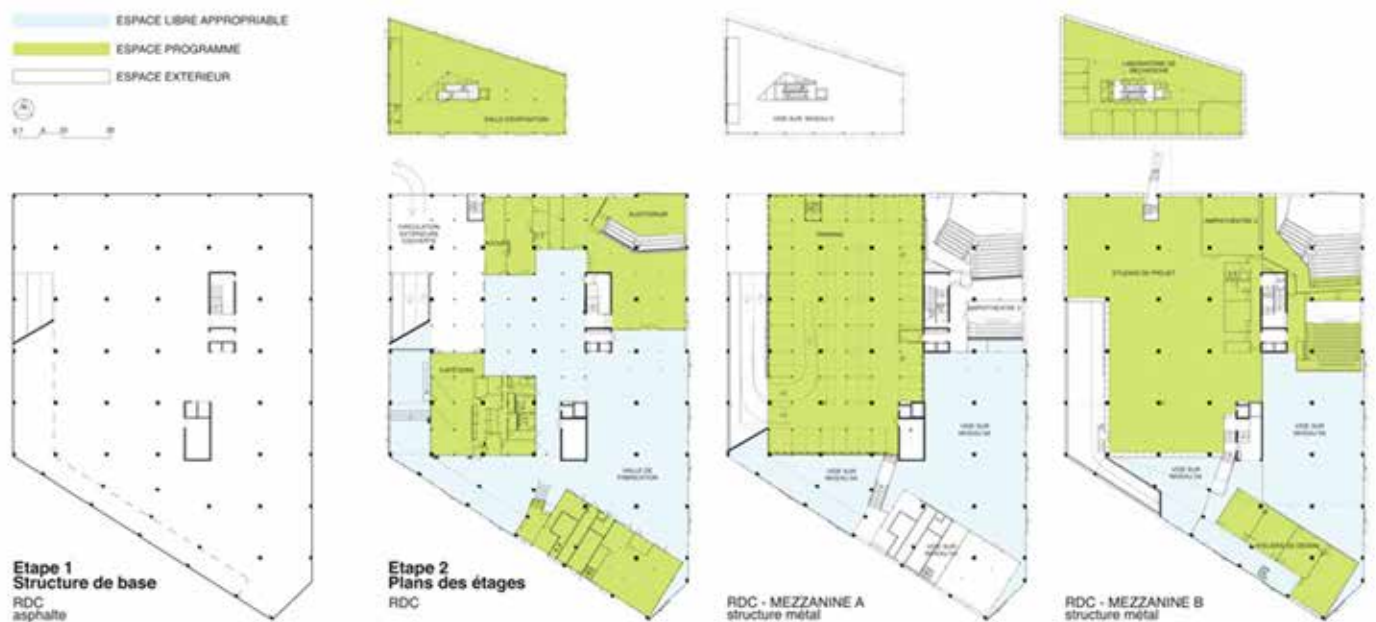
Figura 3: Plantas de la Escuela Nacional Superior de Arquitectura (ENSA) de Nantes.

Abolidas las tipologías, volvemos al gesto de la Schröder Haus . En contrapartida y frente a la modestia técnica de la EPS IV, la Escuela Nacional Superior de Arquitectura, ENSA, de Nantes hace oportuno alarde de depuradas tecnologías de vanguardia aplicadas a materiales no naturales de bajo coste, en una suerte de ingeniería con tintes de bricolaje (cfr. Ruby y Ruby, 2007 a , pp. 17-19) que, ajena a cualesquiera efectos plásticos y convenciones visuales, evoca ciertas prácticas del viejo Brutalism . En ello, la pareja Lacaton & Vassal se alinea con Herzog & De Meuron, en la voluntad de que su firma sea carecer de firma. Si sus fábricas no son de este lugar, tampoco vienen de otro . Lo que importa es el momento: actual y futuro.