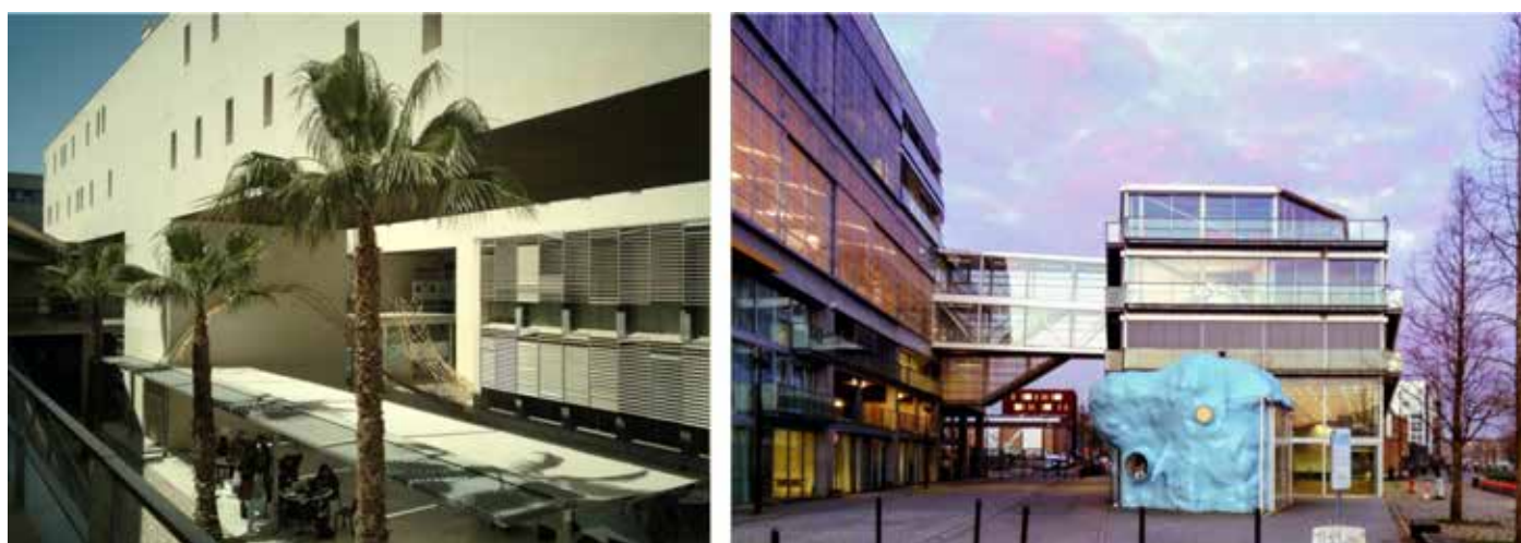
Figura 1: Escuela Politécnica Superior IV de Alicante (izq.) y Escuela Nacional Superior de Arquitectura de Nantes (dcha.).

Por último, debemos explicitar que nuestro trabajo aborda el estudio de ambos edificios a través de un método de análisis comparativo para el cual, previamente, se han establecido una serie de parámetros de reducción que permiten interpretar cada caso concreto de acuerdo con aspectos genéricos (Calduch, 2001). Estos términos abstractos, teóricos, recorren la composición y los proyectos, el espacio y sus usos, las referencias y el contexto temporal. A la luz de estos conceptos resulta la comparación de los proyectos, de su materialización y de las obras mismas en las que concluyen y con las que se concluye.