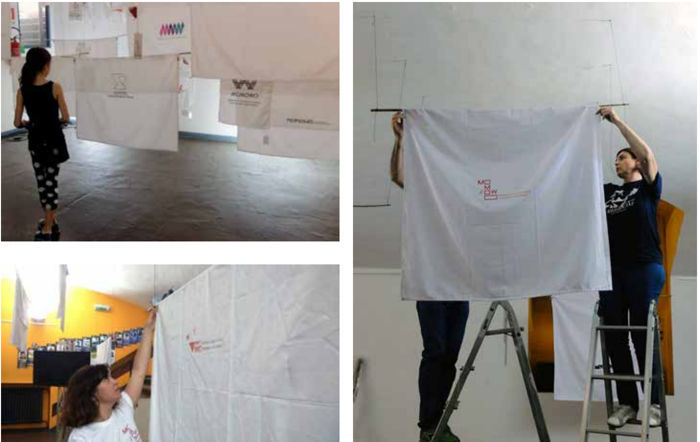
Figura 1: Presentación de los diseños del concurso público para dotar de imagen corporativa al proyecto MoMoWo en el Festival dell'Architettura de Turín en julio 2015.

No debemos olvidarnos que los pilares de MoMoWo son académicos, y, por tanto, buena parte de sus paquetes de trabajo están basados en la investigación pura y dura. Con el fin de crear también una red de profesionales y especialistas académicos dentro del ámbito profesional que abarca el proyecto, se celebraron sendos congresos anuales. Así en septiembre de 2015 se celebró en Leiden (Holanda) el I International Conference-WorkShop , dirigido a trabajos relacionados con las mujeres en el diseño y la arquitectura desde 1918 hasta 1945. En octubre de 2016 tuvo lugar el segundo encuentro científico en el Research Centre of Slovene Academy of Sciences and Arts Slovenia , abarcando el periodo histórico desde 1946 hasta 1968. En octubre del 2017 tuvo lugar el III International Conference-Workshop organizado por la Universidad de Oviedo aceptando trabajos académicos sobre el rol de las mujeres desde 1969 hasta 1989. 3 En junio del 2018, como colofón del proyecto, tendrá lugar en Turín, Italia, el Final Symposium de MoMoWo, cuyo reclamo virtual podemos ver en la Figura 2 , que contará con la participación de arquitectas y profesionales de los diferentes sectores con carreras ya consolidadas y a estudiantes y expertos de todo el mundo.