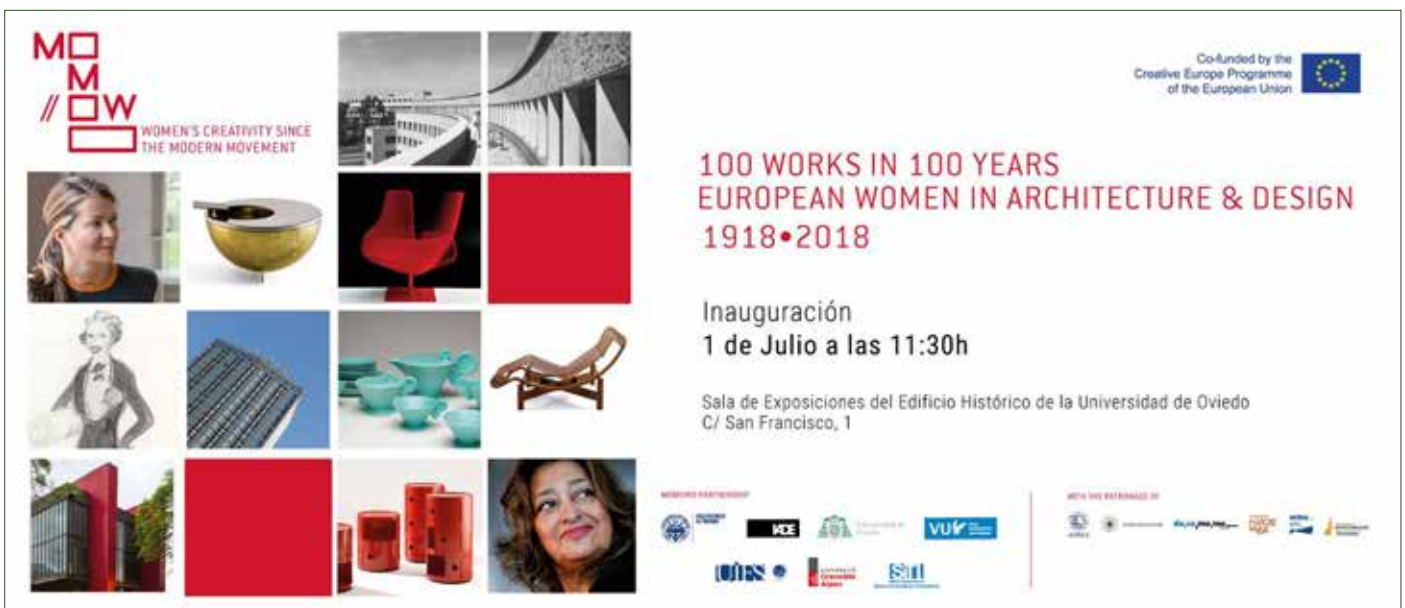
Figura 3. Póster de la Exposición Internacional Itinerante.