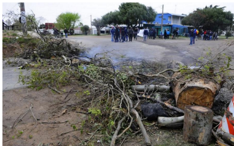
La Policía también fue apoyada por la unidad antidisturbios de la Prefectura, Foto: M. Bonjour.