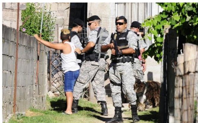
Efectivos de la Republicana persiguieron a un sujeto que quiso esconderse.