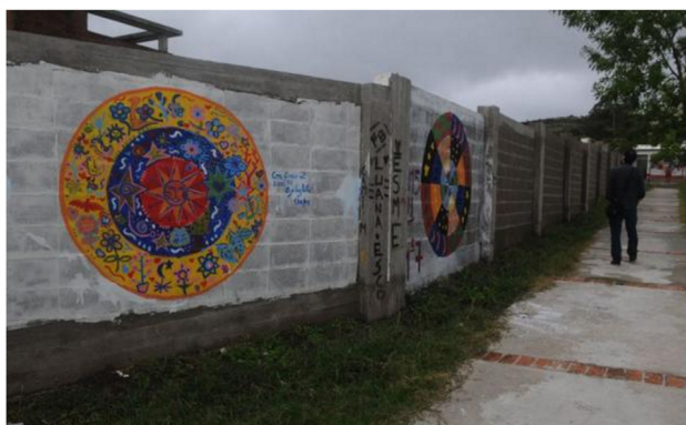
Luego de siete años de reclamos, el liceo logró tener un muro.