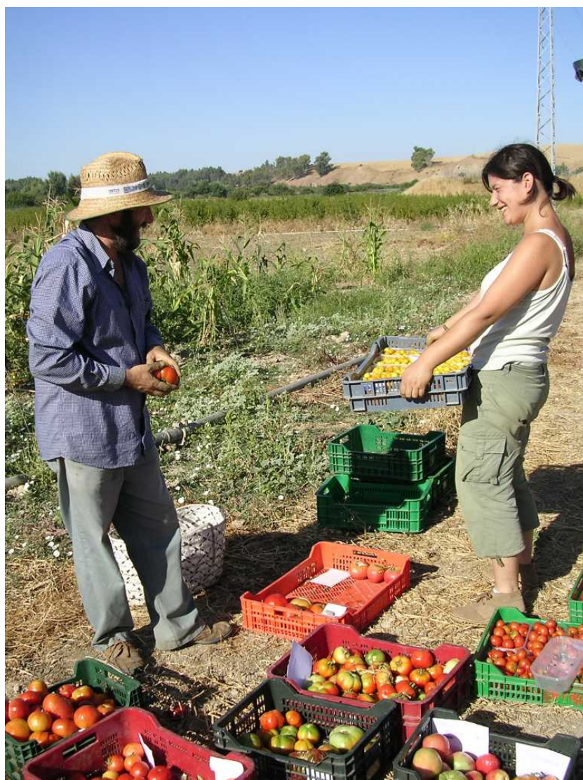
Figura 3. Agroecología.

tad del siglo XX la industrialización agroalimentaria y la crisis de las comunidades campesinas como modo de vida (Naredo, 1971). La ciudad se construye contra el campo, a veces para destruirlo y otras para reconfigurarlo a su servicio.