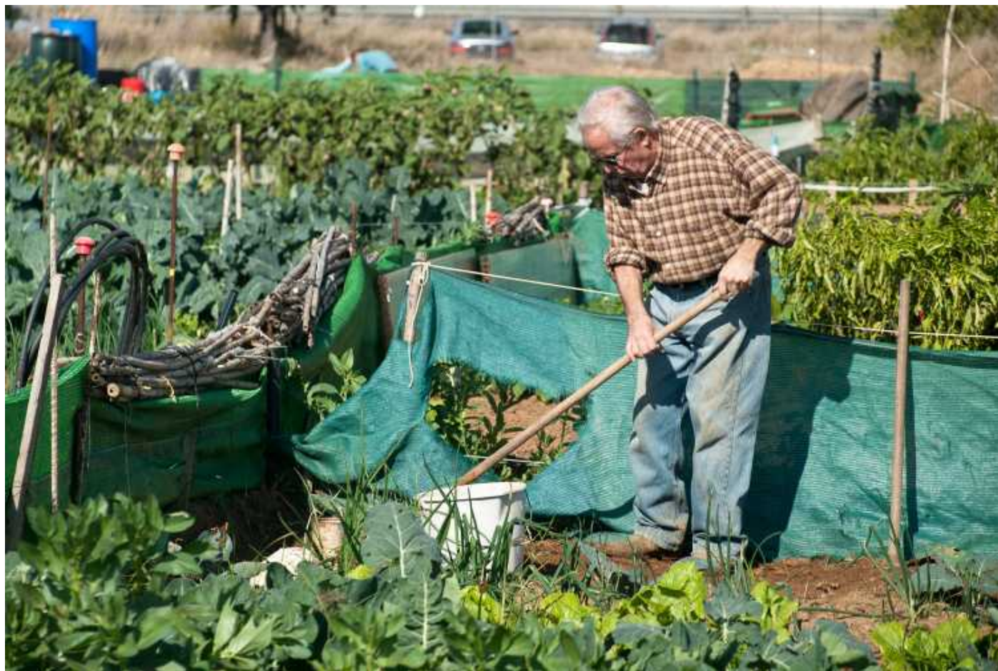
Figura 6. Huerto del Parque Tamarguillo.

En respuesta al incumplimiento municipal, se va activando la respuesta ciudadana y a finales de la década de los noventa tiene lugar un