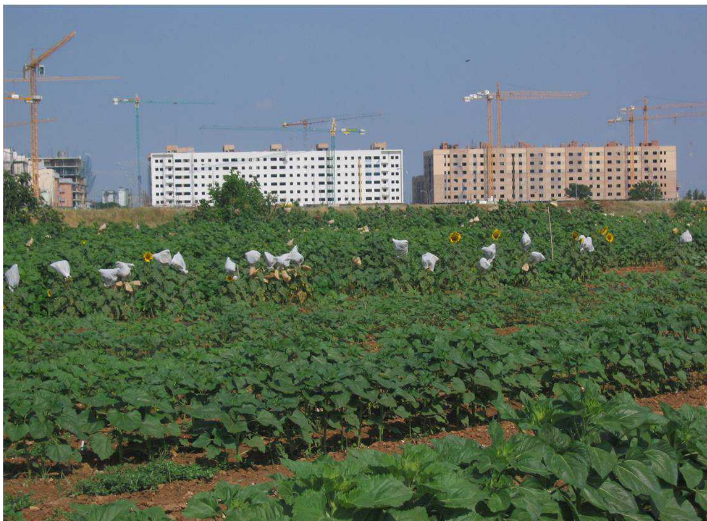
Figura 1. Fuente: Marta Soler.

dio natural rural”, 2 se proponía urbanizar el 54% del actual suelo agrícola del territorio municipal. 3 Pese a la retórica de la sostenibilidad, Sevilla crece contra el campo.