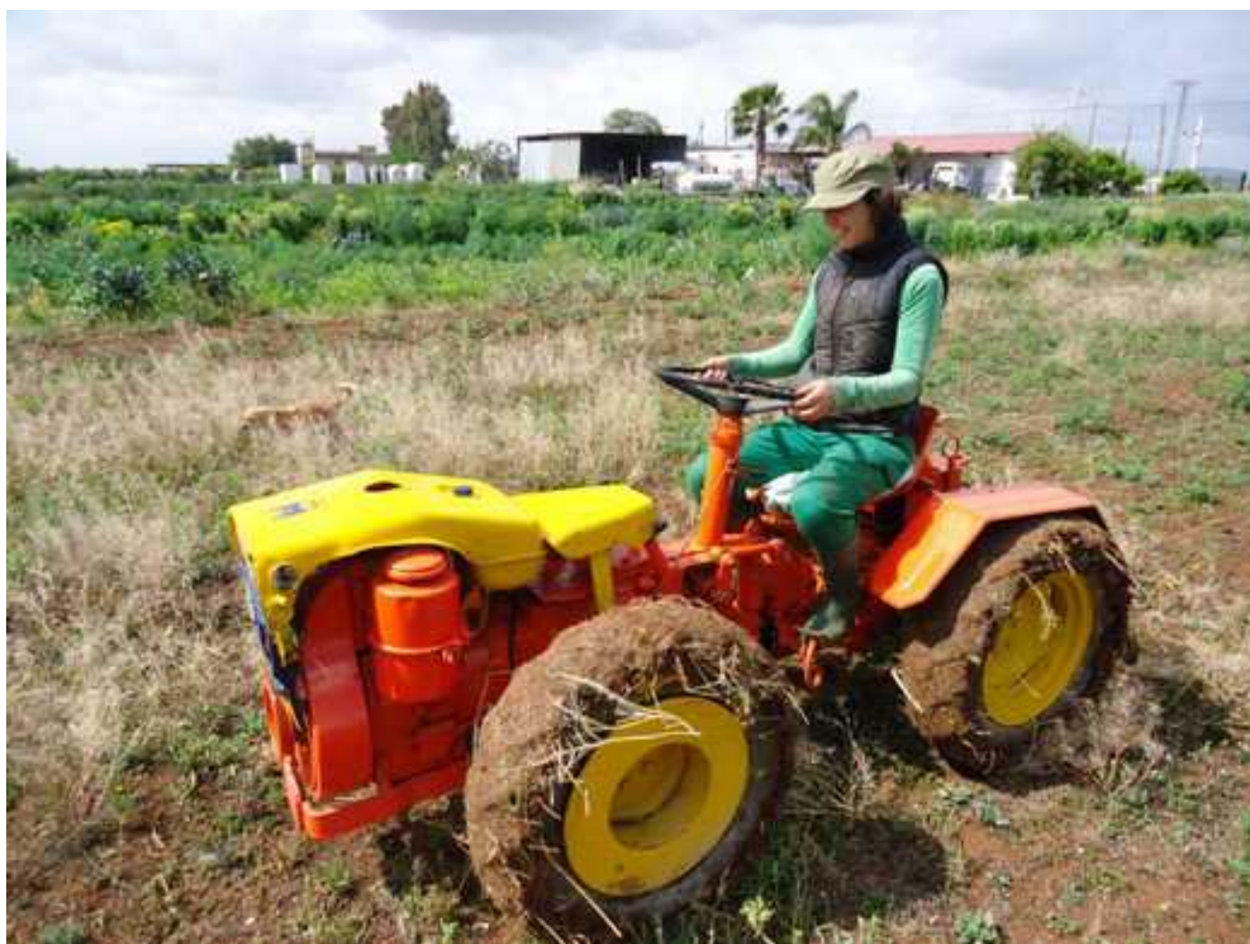
Figura 9. Con los pies en la tierra.