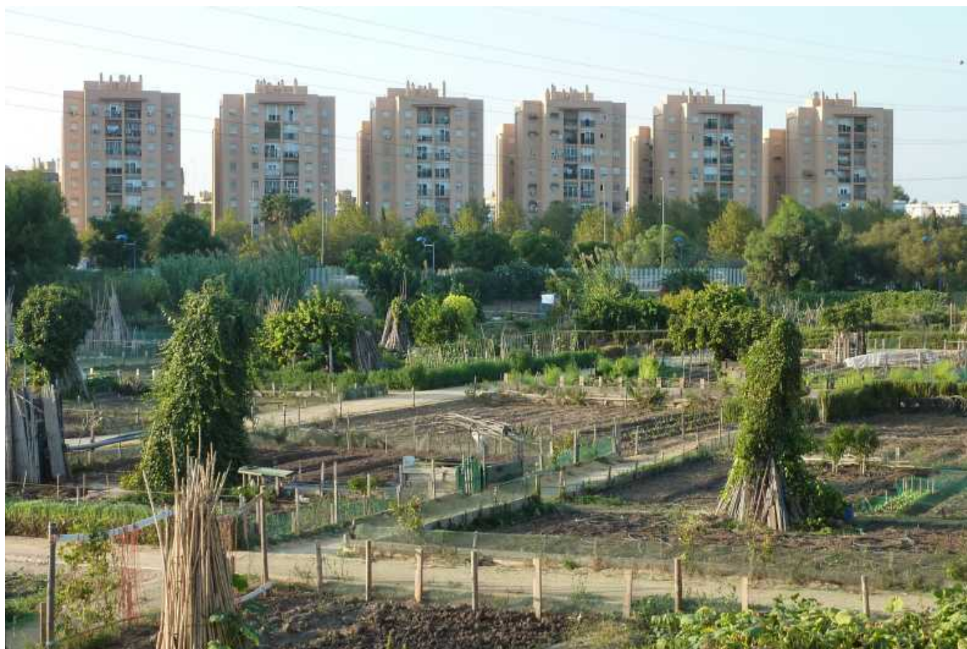
Figura 5. Huertos Parque Miraflores.

Actualmente, las actividades en los huertos se aglutinan en el “Pro-