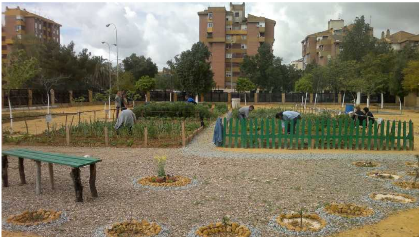
Figura 7. Polígono Sur.

cultivando los huertos y se mantiene al margen del conflicto político abierto entre el Ayuntamiento y la Asociación. En este momento, se pone de manifiesto la complejidad y fragmentación de agentes y relaciones vecinales en torno al Parque y los huertos que muestran una menor cohesión sociopolítica que en el caso de Miraflores.