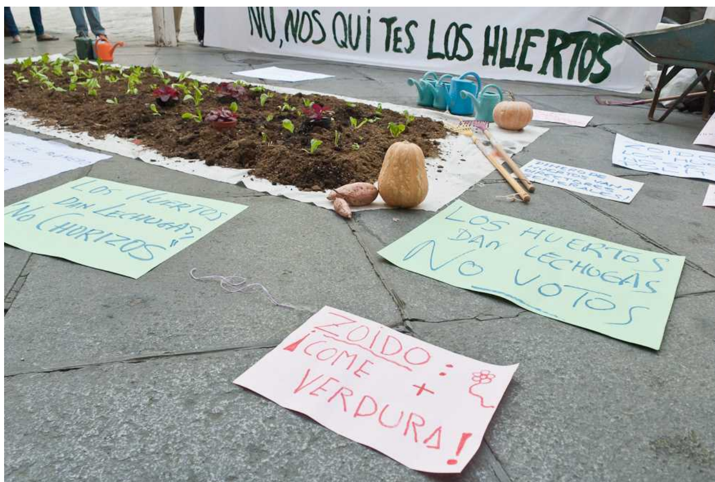
Figura 2. Lucha por el derecho a la ciudad.