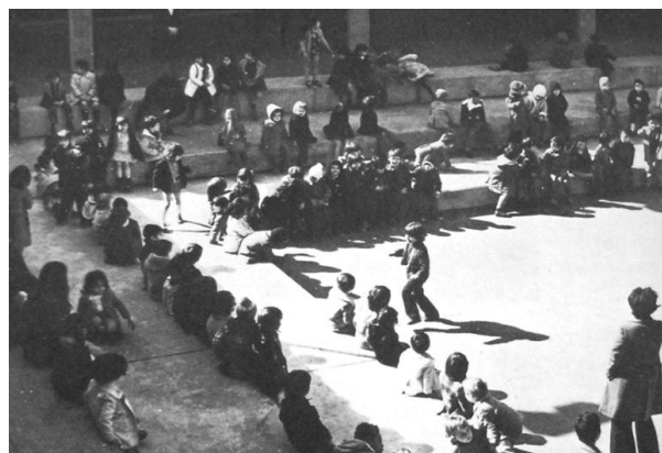
Figura 5. Bellefontaine, alumnos en una de las escuelas infantiles, sobre 1972. Fuente: Candilis-Josic-Woods, 1976, p.64.

La diversidad social existente, cuando el barrio comienza a ser habitado, se convierte también en