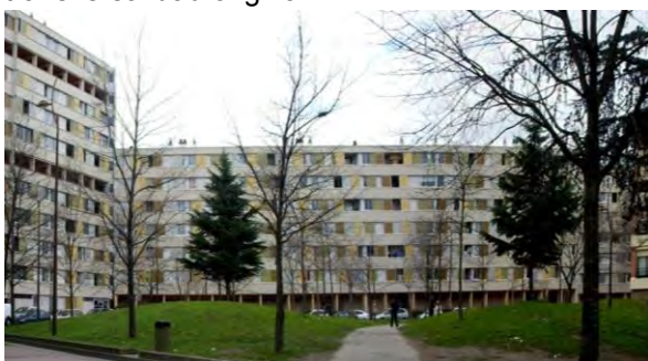
Figura 10: Bellefontaine, primera fase GPV: resultado de las operaciones de rehabilitación de los grandes bloques, 2011.

Las intervenciones de rehabilitación del GPV de Toulouse le Mirail en los grandes y pequeños bloques conservados (Figura 10), realizadas en Bellefontaine, se han concentrado en cambio principalmente en el aspecto exterior: se han renovado así los materiales de revestimiento del cerramiento exterior, acondicionándolos térmicamente, y los paneles de las correderas de las loggias ; y en los pórticos de las plantas bajas se han incorporado puerta de acceso en cada uno de los núcleos verticales, desapareciendo así la transversalidad original.