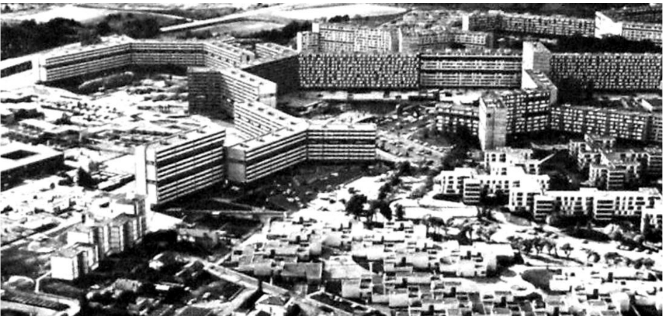
Figura 2. Bellefontaine, vista de los tres tipos de edificios residenciales, equipamientos y edificios docentes, sobre 1972.

reflejaba la construcción de un nuevo contexto, asociado a nuevos modos de habitar en la ciudad moderna, e incluía gran parte del programa previsto, tanto viviendas como equipamiento, permitiéndole así en el futuro funcionar de manera adecuada, y como un verdadero núcleo autónomo.