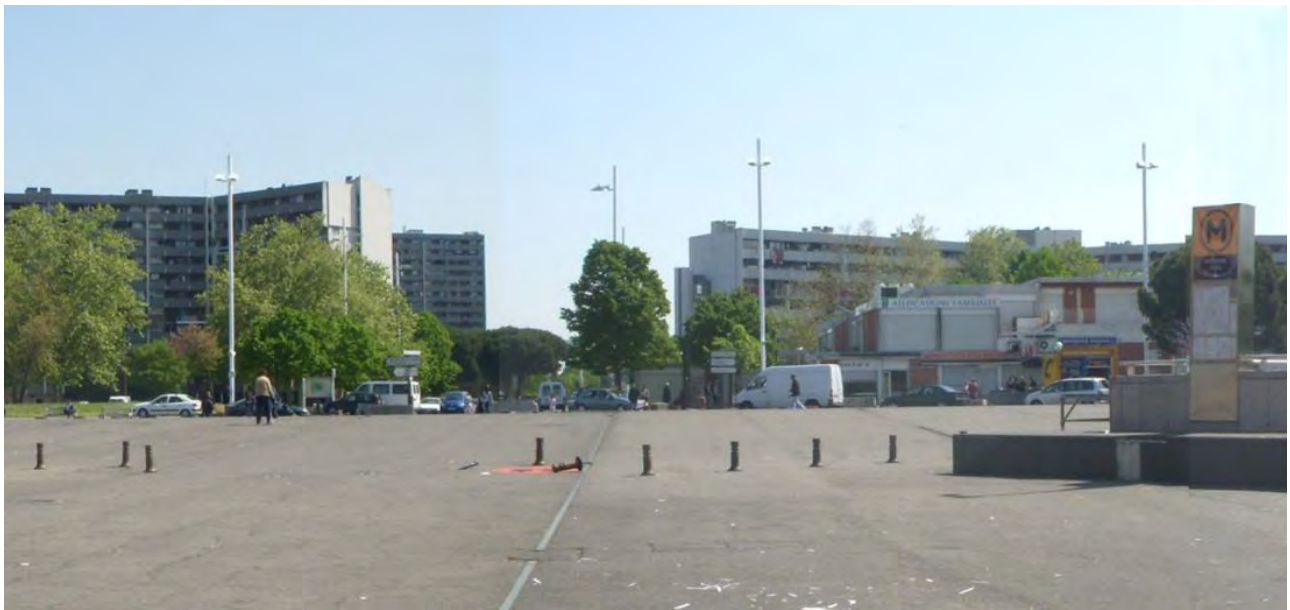
Figura 7. Reynerie, nueva centralidad tras la demolición de la “dalle”, estado nueva actual Plaza Abbal, 2011.