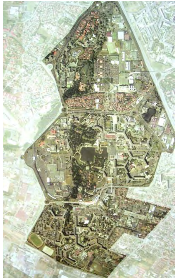
Figura 8. Toulouse le Mirail: Bellefontaine, Reynerie, Mirail; vista aérea de la estructura urbana antes del GPV, 2002.

Toulouse le Mirail había comenzado a transformarse en un ghetto de la ciudad, y especialmente su barrio central de Reynerie. Su integración en el tejido residencial de Toulouse será cada vez más difícil y compleja, y el gran barrio irá formando parte, poco a poco, de la denominada banlieue 10 . La cit  satellite original construida por Candilis-Josic-Woods se había transformado lentamente en un “barrio dormitorio”, tras las décadas de barrio idílico, y estaba cada vez más aislado de la ciudad.