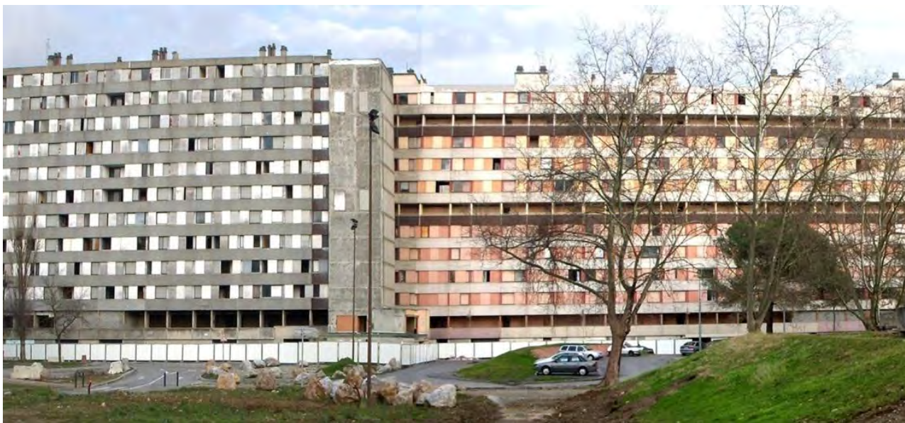
Figura 9. Bellefontaine, primera fase GPV: grandes bloques antes de ser demolidos, 2010.

Una línea general de operaciones de demolición-reconstrucción de viviendas aplicadas por los Grand Projet de Ville también en muchos grands ensembles en Francia, y donde se debe destacar inevitablemente un factor muy importante: la asociación directa de esta estrategia de demolición de viviendas con la búsqueda de reducción del número de habitantes y, con ello, de los problemas sociales existentes en la actualidad en las banlieues .