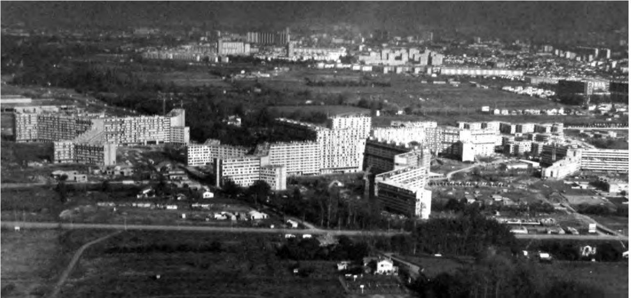
Figura 2. Bellefontaine, primera fase de ejecución, 1969.

A pesar de que esta primera fase de Toulouse le Mirail no fue completada, el resultado final del conjunto urbano conseguía trasladar el concepto arquitectónico propuesto por Candilis, Josic y Woods (Figura 2), principalmente a través de la estructura urbana generada por los grandes bloques (Figura 3), así como por la sección de la dalle que conectaba a los barrios. El conjunto