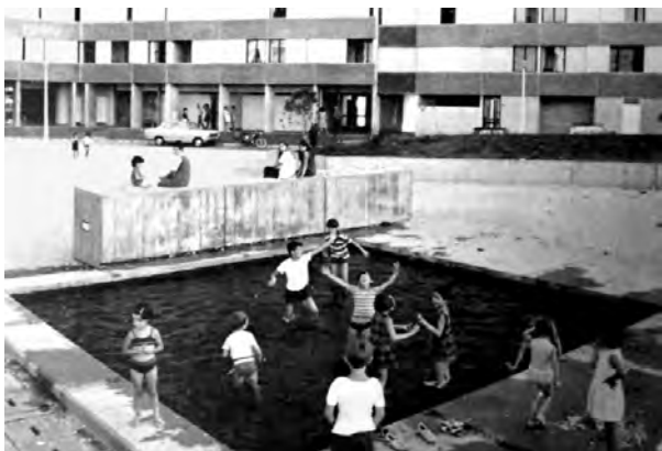
Figura 6. Bellefontaine, niños en uno de los espacios públicos entre los grandes bloques, sobre 1972.

Así, ante esta situación, un estudio sociológico realizado en Toulouse le Mirail en 1981 (AMT, 1981) revelaba algunos datos interesantes sobre su realidad social, y conseguía reflejar además el alto grado de satisfacción de los habitantes en el gran barrio, donde destacaban principalmente aspectos como la calidad espacial de las viviendas, la gran superficie de espacios públicos; y donde valoraban mucho también el funcionamiento de los edificios docentes y los equipamientos, y de los numerosos espacios públicos y de juego (Figura 6).