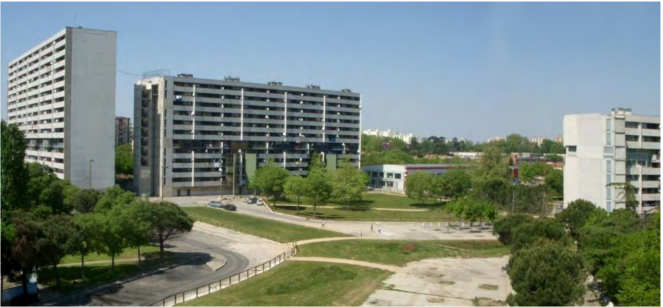
Figura 11. Reynerie, primera fase GPV: resultado de la demolición de grandes bloques y acondicionamiento del espacio público, 2011.