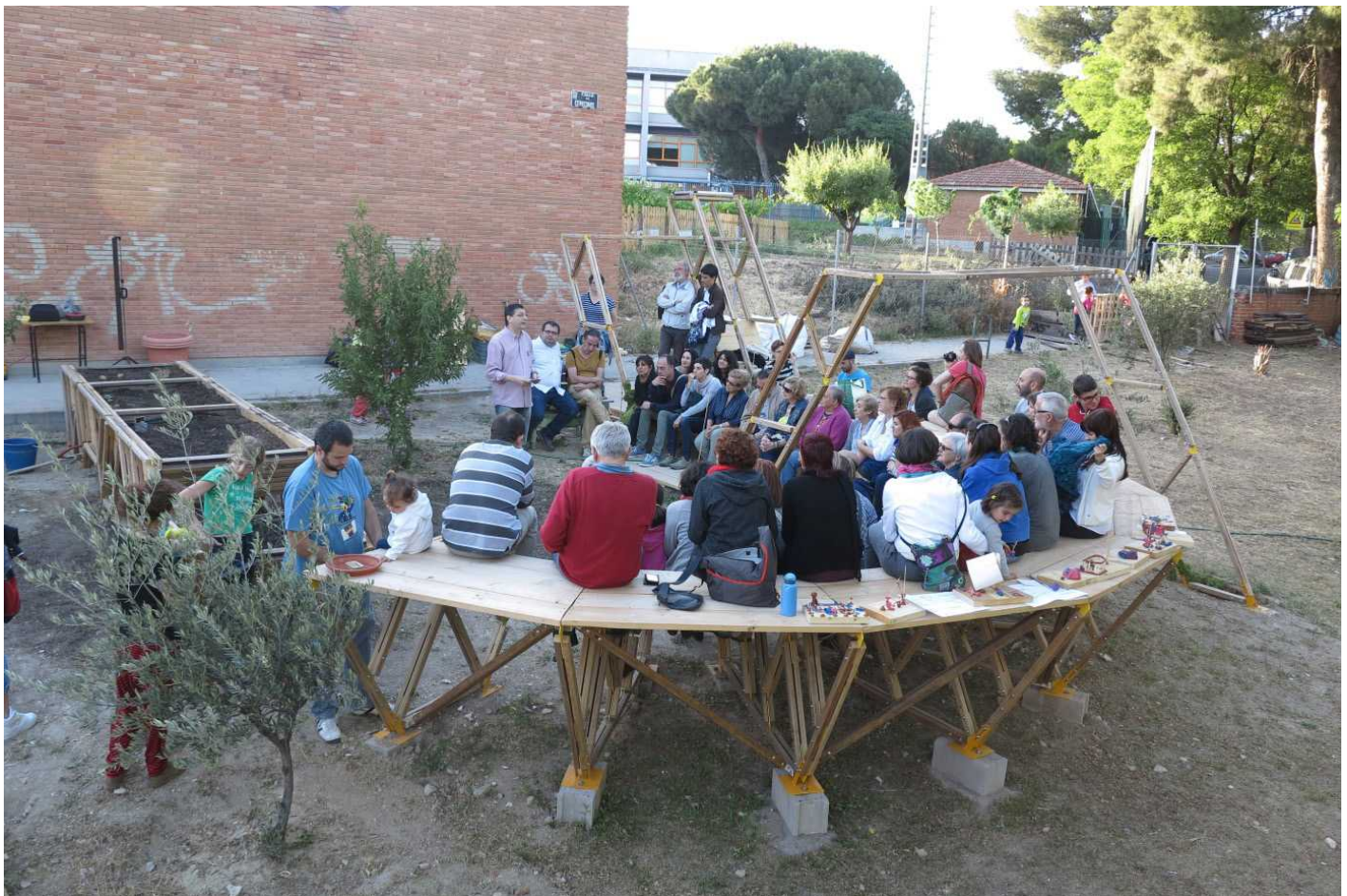
Figura 2. Encuentro vecinal en la U de Usera.

... ha sido una oportunidad de generar lugares de encuentro para construir algo más los vecinos. El proceso fue muy rico, el cómo buscar y cómo encajar eso que necesitan los vecinos [...]. Pero la experiencia está por venir, a medida que se vaya generando actividad y mayor participación de más gente. [...]. Aunque ya es un espacio que se tiene en cuenta en el barrio.