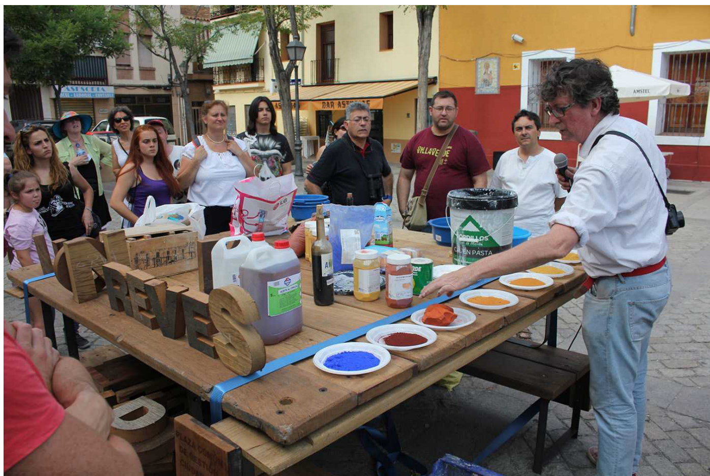
Figura 7. Jornada-taller en Comunes Villaverde.

El banco convertible se adosa al solar cuyo muro ha sido intervenido por el artista e1000, mientras que los paneles-armarios expositivos han sido instalados en la medianera del único edificio catalogado por patrimonio histórico-artístico de la Plaza Mayor de Villaverde, de titularidad municipal y cedido a Bomberos Unidos Sin Fronteras. Es aquí donde, a su vez, se ha instalado el punto de Guifi.net como contribución tecnológica de los jóvenes de Creática a esta intervención, y como resultado