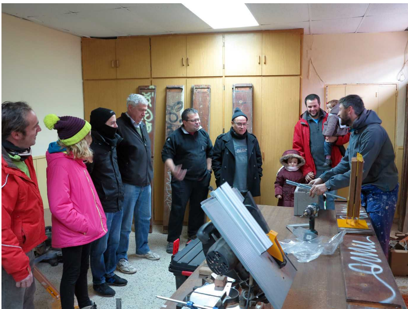
Figura 1. Sesión de co-construcción de la U de Usera.