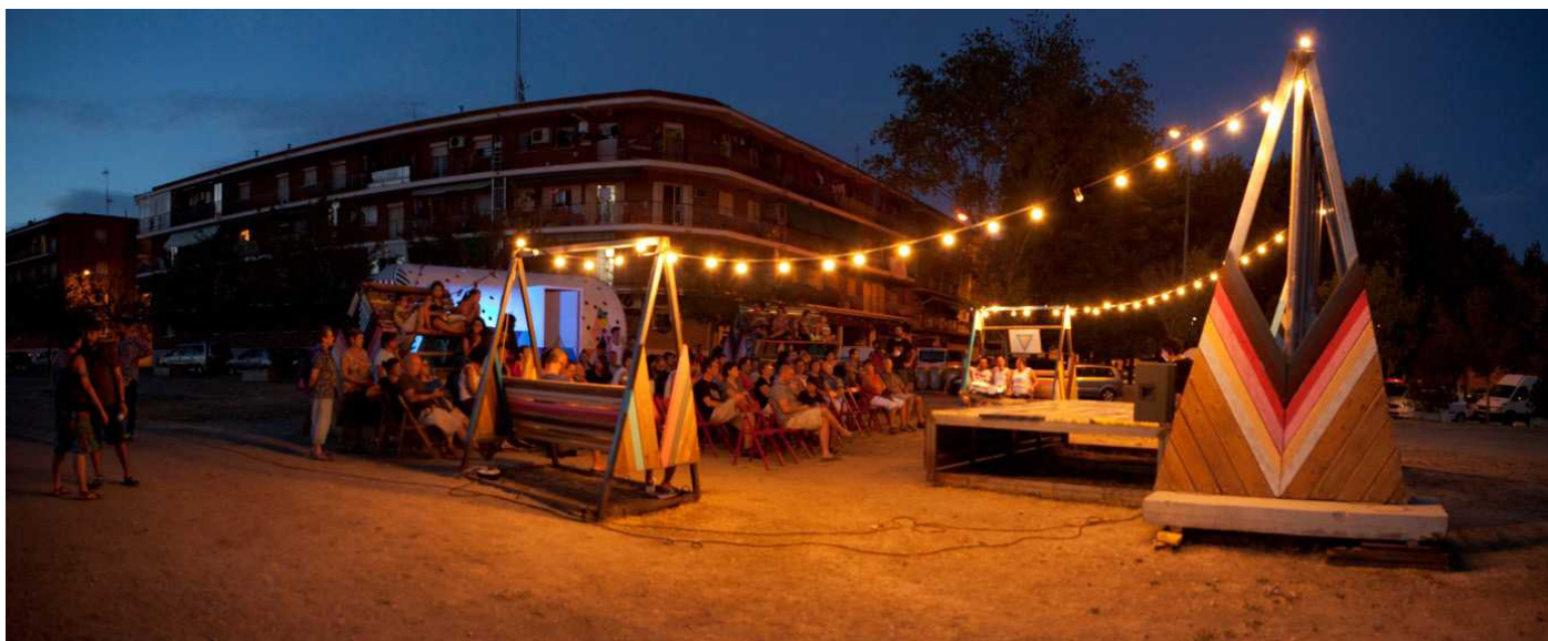
Figura 6. Proyección nocturna en Cinema Usera.

rador de Orcasitas, los caminos y veredas han sido marcados por el tránsito natural de las personas al atravesarlo. La instalación queda ubicada en un área acotada por estos caminos y elevada frente a la plaza, lo que convierte a la intervención y, sobre todo, a las gradas en un nuevo e interesante punto de observación (o mirador) del paisaje del sur madrileño.