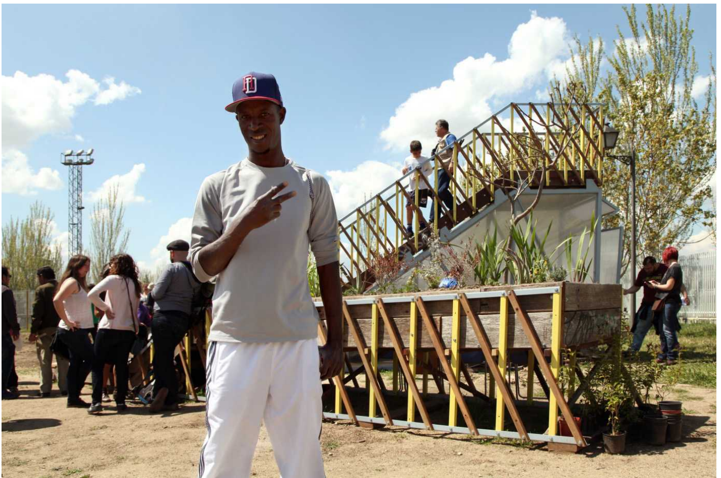
Figura 3. Encuentro vecinal en la V de Villaverde.

En colaboración con Basurama y el huerto de la parroquia, se compone una estrategia en torno a las letras (U de Usera y V de Villaverde) para arrancar y explicar las infraestructuras a construir. Así lo explica Manu de Zuloark: “Se propone una V y el proceso participativo la rellena con un invernadero, armarios, bancales, etc.”. Un objeto capaz de modelarse, incluir programas diferentes, desarrollarse en función de las necesidades, pero también un objeto que permita generar objetos de mediana escala y construir identidad y comunidad. Porque el dibujo