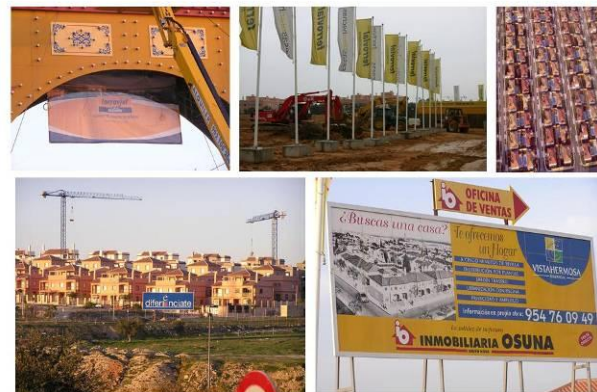
Figura 8: Proceso urbanizador del Aljarafe, en el Área Metropolitana de Sevilla.

La URBS resultante es un territorio desestructurado. Una sucesión de urbanizaciones colgadas del viario local preexistente. La CIVITAS rural se ha visto transformada por un aluvión de nuevos habitantes urbanitas que han venido al Aljarafe comprando el sueño de una casa propia adosada, con jardín, a cinco minutos de Sevilla en urbanización con piscina (Figura 8). Los carteles de las promociones venden un arquetipo de casa andaluza con teja árabe. Sobre un fondo de viviendas clónicas un cartel reza: "diferénciate" (si puedes, que añadiría el autor de la foto).