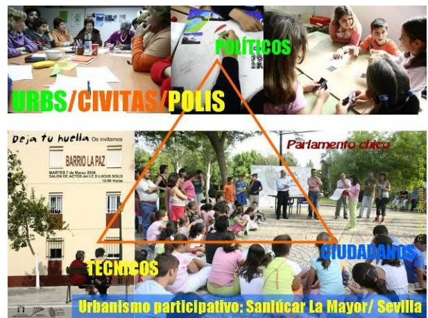
Figura 11: Construcción del triángulo de la gestión social del hábitat en la elaboración del Plan General de Sanlúcar La Mayor (Sevilla). Elaboración propia.

un informe urbanístico que fue presentado como el libro blanco del Aljarafe, acabó solicitando a la administración una moratoria urbanística. Empresarios, nuevos vecinos que han visto frustrado su sueño de un lugar para vivir, ecologistas, universitarios, han creado una emergente polis ciudadana antagónica de los intereses especulativos respaldados por las autoridades municipales ante la pasividad de la administración autonómica. En Sanlúcar La Mayor tuvimos la oportunidad de asesorar a un joven equipo de gobierno municipal que había ganado las elecciones tras liderar la oposición a un salvaje plan municipal. Su consigna era hacer un planeamiento sostenible y participativo. En las mesas de participación surgió la propuesta de mantener el carácter rural de este municipio del segundo cinturón del Aljarafe, limitando los desarrollos urbanísticos a lo necesario para el crecimiento vegetativo de la población y para asentar actividades productivas (Figura 11).