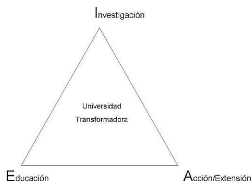
Figura 4: El triángulo de la función transformadora de la Universidad.

Investigación, Educación y Extensión pueden constituir tres vértices de un triángulo complejo en la medida en que las relaciones entre estas tres funciones son dialógicas y recursivas. De este modo es posible implicar a la universidad como actor relevante en los procesos de estudio e intervención sobre el hábitat. Y es posible hacerlo de forma compleja mediante la interacción de estas tres dimensiones. Ante una misma demanda de asesoría técnica que llegue a la Universidad en relación con una situación de hábitat, ésta puede responder diseñando acciones en las que se construye conocimiento implicando a los técnicos y profesionales en formación, llevando esa demanda de una situación real al aula y tomándola como oportunidad pedagógica, y en el marco de un convenio de colaboración con los actores sociales y las administraciones implicadas en la situación, de modo que se creen espacios de participación para la toma concertada de decisiones sobre la situación de hábitat que ha generado la demanda de asesoría. Esto, desde nuestra experiencia, es posible hacerlo tanto en los cursos de grado como, de forma particularmente intensa, en los de postgrado. De este modo los equipos de profesores y estudiantes implicados, junto con el resto de actores, pueden verse inmersos en procesos en los que simultáneamente se investiga, se aprende y se transforma una realidad de hábitat.