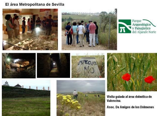
Figura 10: Visita guiada al territorio dolménico donde la iniciativa social promueve el Parque Arqueológico y paisajístico del Aljarafe (Sevilla). Elaboración propia. Fotografías del autor.

En este contexto parece difícil que surja una POLIS. Sin embargo, donde hay problemas de hábitat surgen grupos dispuestos a organizarse para afrontarlos. La plataforma Ah! ("Aljarafe habitable") aglutina a activistas que demandan participación ciudadana para poner orden en el territorio. Asociaciones ecologistas y de defensa del patrimonio han tomado la iniciativa para proteger espacios de gran valor paisajístico, como la propia cornisa, proponiendo la creación de un parque arqueológico paisajístico que permita conocer y divulgar los importantes yacimientos dolménicos de los primeros asentamientos humanos sobre estas tierras de Sevilla (Figura 10).