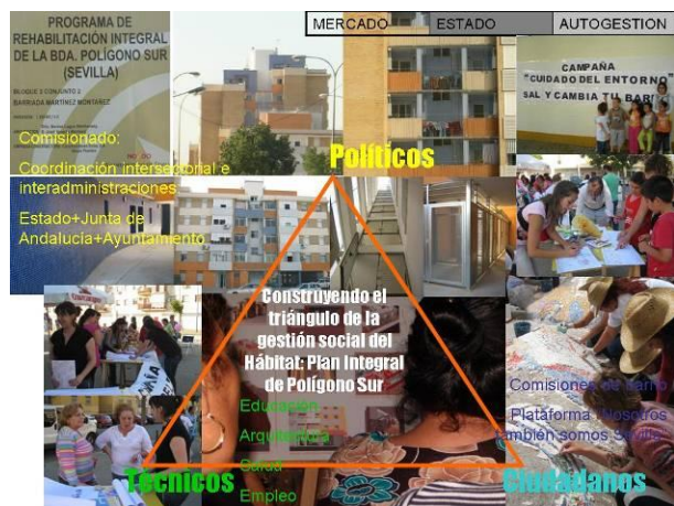
Figura 18: Construcción del triángulo de la Gestión social del Hábitat en el Plan Integral de Polígono Sur. Elaboración propia. Fotografías de S.U.R.C.O. y de los alumnos del Máster en Gestión Social del Hábitat.

cuatro ejes de intervención: urbanismo y convivencia; salud comunitaria, intervención socioeducativa y familiar, inserción sociolaboral; e iniciativa económica (Comisionado para Polígono Sur, 2004).