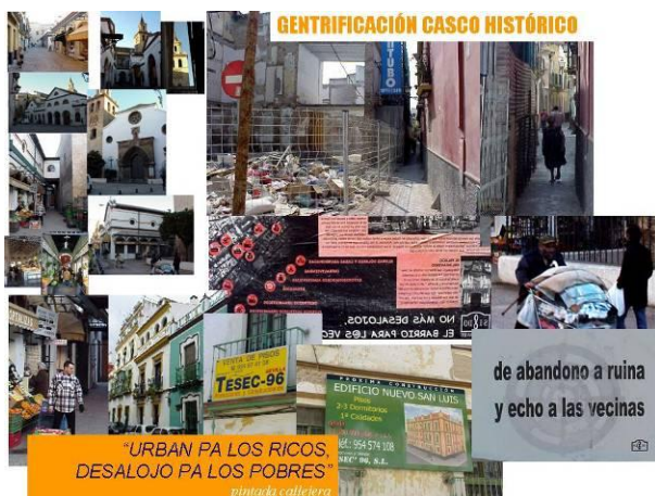
Figura 12: Gentrificación en el Norte del Casco Antiguo de Sevilla. Elaboración propia. Fotografías del autor.

Mientras esto ha ocurrido en los suburbios de clase media de las ciudades, los centros históricos se han visto atacados por procesos de gentrificación (Figura 12). Los inversores han comprendido que el valor simbólico de estas áreas les presta grandes oportunidades para obtener beneficios económicos.