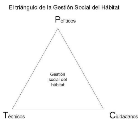
Figura 3: El triángulo de la Gestión Social del Hábitat.

En tercer lugar destacamos al conjunto de los ciudadanos como usuarios demandantes de necesidades en materia de hábitat, como promotores o como autogestores.