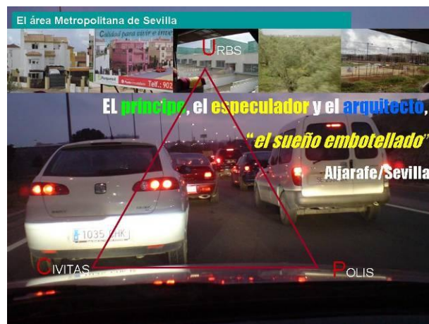
Figura 9: El sueño embotellado. Elaboración propia. Fotografías de Luis Andrés Zambrana y del autor.

Estos nuevos habitantes han establecido en general muy pocos vínculos con los pueblos en los que se ubican sus urbanizaciones. Su trabajo está en Sevilla, las compras y el ocio se reparten entre la ciudad y los grandes centros comerciales ubicados en los nudos de las autovías. Buena parte de ellos no se empadronan o tardan en hacerlo, por lo que ni siquiera votan a sus alcaldes. El territorio de las metrópolis se compone de vías con rotondas, urbanizaciones, polígonos industriales y centros comerciales. Es casi imposible recorrerlas a pie o en bicicleta. Las redes de transporte público no han sido previstas. Y la dependencia de una ciudad a la que hay que acceder y de la que hay que salir por tres únicos puentes acaba convirtiendo el sueño en pesadilla: atrapados en los atascos para ir y volver del trabajo (Figura 9).