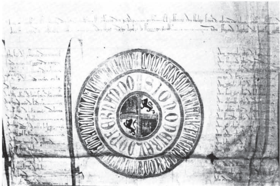
Crismón y rueda del privilegio de confirmación dado por Fernando IV (doc. núm. 1).