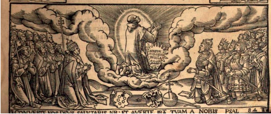
Figura 2. Detalle de la parte inferior de la portada. D. Dionysii Carthusiani Operum Minorum... Colonia, Johannes Soter, 1532. BH FLL 6356, Biblioteca Histórica Marqués de Valdecilla de la UCM.