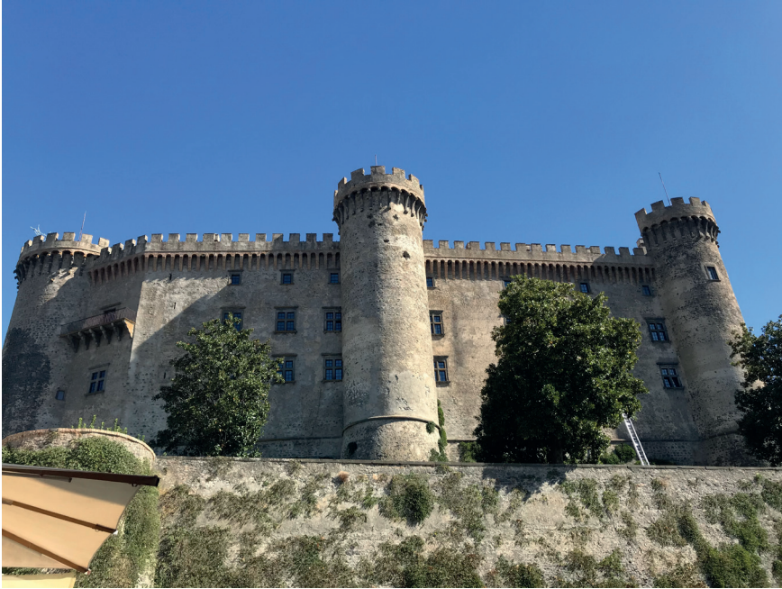
Fig. 6 Castello Orsini-Odescalchi, Bracciano.