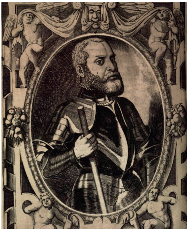
Figura 3. Ritratto di Giordano Orsini da Sansovino, 1575, f. 85v.