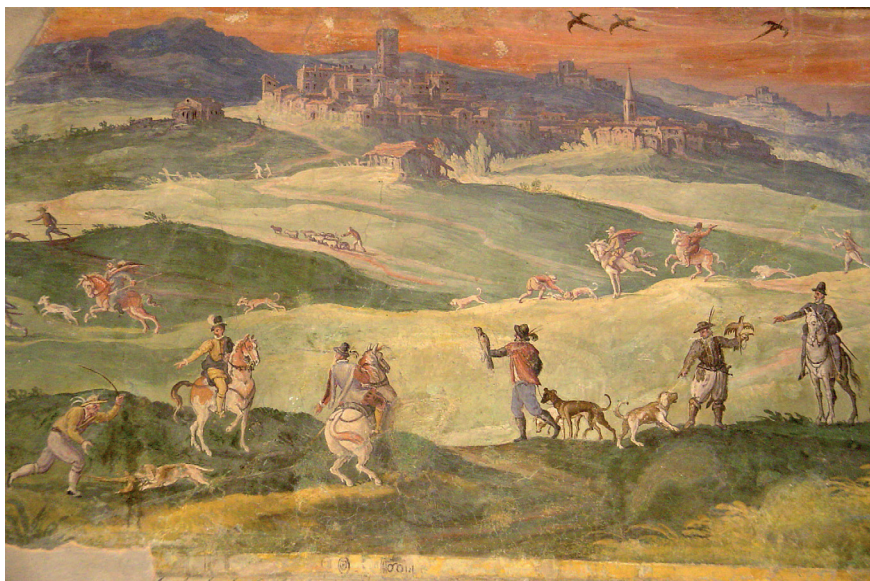
Figura 4. Paul Brill, Veduta di Monterotondo, 1582, Stanza con scene di caccia, Palazzo Orsini, Monterotondo.

in qualità di conduttore, e Troilo Orsini, anche a nome del fratello Mario, quali locatori, stipularono un contratto d'affitto che riguardava