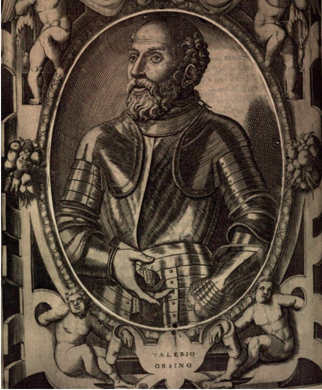
Figura 2. Ritratto di Valerio Orsini da Sansovino, 1575, f. 83v.

carte mostrano un fattivo esercizio del potere che non si riduceva ad un mero teatro di vanità 12 .