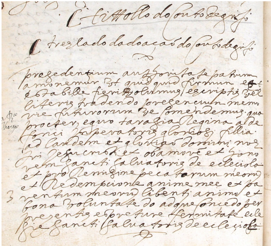
Figura 1. ADP, Convento de S. Salvador de Grijó, Tombo 1598 – 1 (Liv. 18), fl. 8v.

“constituem o único exemplar conhecido das cartas mais antigas que eram sujeitas a confirmação” 24 . Afortunadamente, muchas de estas confirmaciones se conservan hoy en día, sin embargo, las que existieron en Grijó acabaron desapareciendo y, por ello, son muy interesantes las descripciones que tenemos de ellas, extraídas de los Tumbos de 1598.