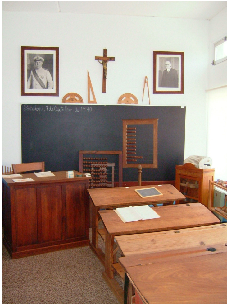
Sala de Aula durante o Estado Novo

lares de gerações sucessivas e que fizeram parte integrante da vida quotidiana e do funcionamento das instituições educativas mais antigas, quer na cidade, quer na região.