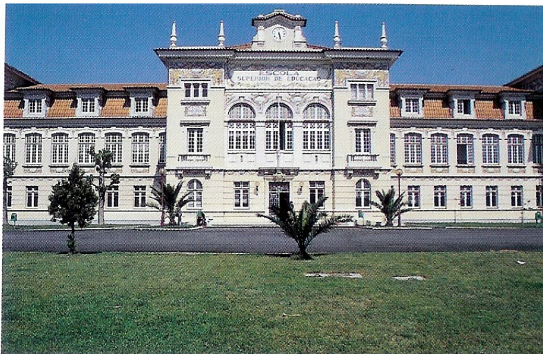
Escola do Magistério Primário de Lisboa, depois Escola Superior de Educação 4