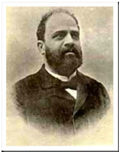
Francisco Adolfo Coelho

Embora não se situe no tempo recente, este primeiro museu representa o início de uma ideia que nos tem acompanhado ao longo de todo este texto. Historicamente, as primeiras referências relativas à constituição de museus pedagógicos, em Portugal, aparecem no último quartel do século XIX. Foi Francisco Adolfo Coelho (1847-1919) que protagonizou a acção mais significativa neste domínio, ao pressionar o município de Lisboa para a criação de um museu pedagógico, entre 1882 e 1883.