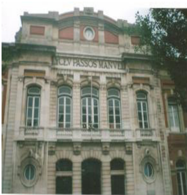
Escola Secundária Passos Manuel (antigo Liceu)