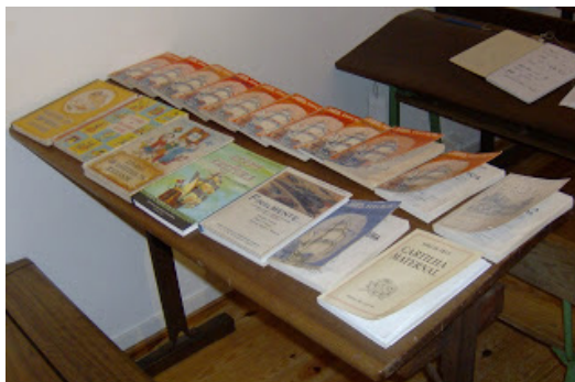
Museu Escolar de Marrazes, Leiria