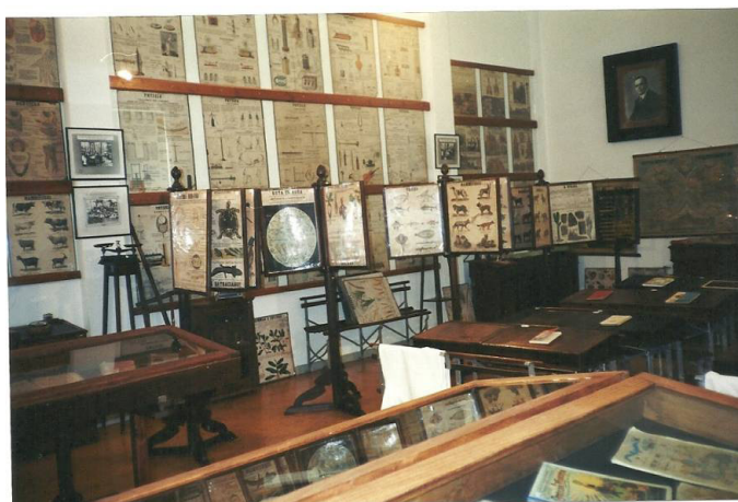
Museu Escolar Oliveira Lopes, de Válega, Ovar

A relação dos aderentes a esta Rede permite-nos ter uma perspectiva de conjunto das iniciativas que foram desenvolvidas. Importa também realçar que outras iniciativas tomaram forma, com ritmos diferentes de desenvolvimento. Tomando, pois, em consideração a relação de aderentes à Rede, registaram-se então 21 projectos e núcleos museológicos. Dedicando-se ao mundo da educação e da infância, constituíram realidades multifacetadas, mas podem enunciar-se alguns dos seus traços dominantes: