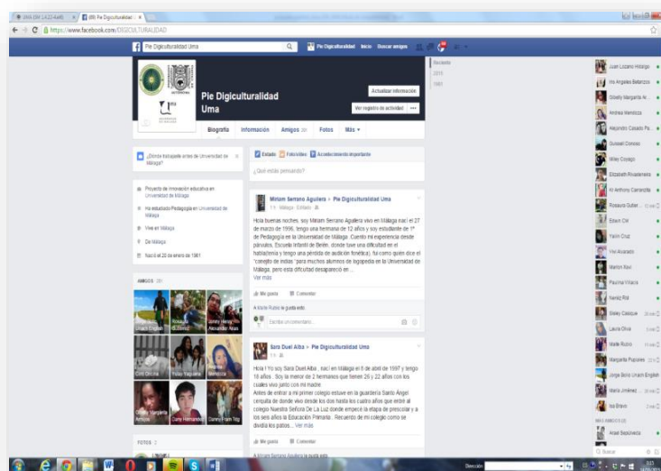
Figura 1. Página de inicio de la Web de Digidigitalidad, del Proyecto de Innovación Educativa.

A fecha de abril de 2017, ya son más de 700 estudiantes de seis universidades (UMA, UEA, UPNA, UPO, UM, UNACH), de tres países distintos (Ecuador, México y España) quienes comparten inquietudes, sueños, esperanzas, aprendizajes e historias. Y decimos precisamente historias, porque, hasta la fecha se han planteado la realización de dos tareas básicas para su desarrollo: