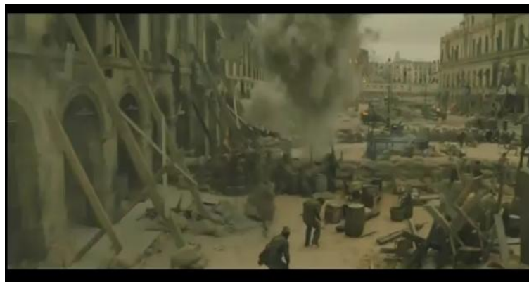
Gráfico nº 5: Representación del género bélico

A través de diversos géneros, Encontrarás Dragones aproxima al espectador a la historia desde diferentes perspectivas. Así, el largometraje desarrolla el género bélico, el dramático y el biográfico. El belicismo se manifiesta a través del eje central del film. Son numerosas las escenas sobre el conflicto armado, en donde ambos bandos aparecen representados con un crudo realismo, pero sobriamente, sin regodearse en escenas particularmente macabras: