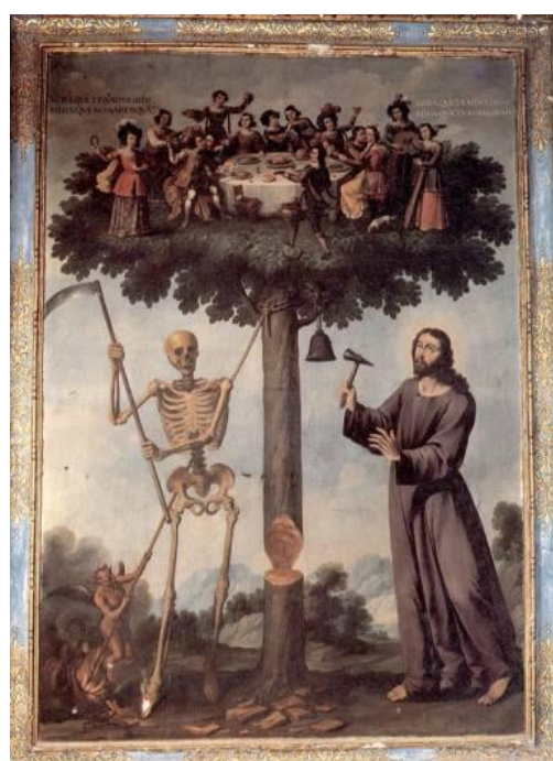
Figura 2. El árbol de la vida . Fuente: Ignacio de Ries (1653)

A lo largo del siglo XVIII los pintores vénetos se especializaron en el sub-género de las “vedute”, perspectivas urbanas que los viajeros extranjeros del Grand Tour veían en sus viajes a Italia y que luego se llevaban como recuerdo a sus países de origen. Este siglo es una de las etapas más apasionantes del paisaje, como los vedutistas de pincelada enérgica, no tan meticulosa con el dibujo, de rasgos rápidos, como Francesco Guardi, Michelle Marieschi, Canaletto, Luca Carlevarijs y Gaspar Van Wittel (Lothe, 1970).