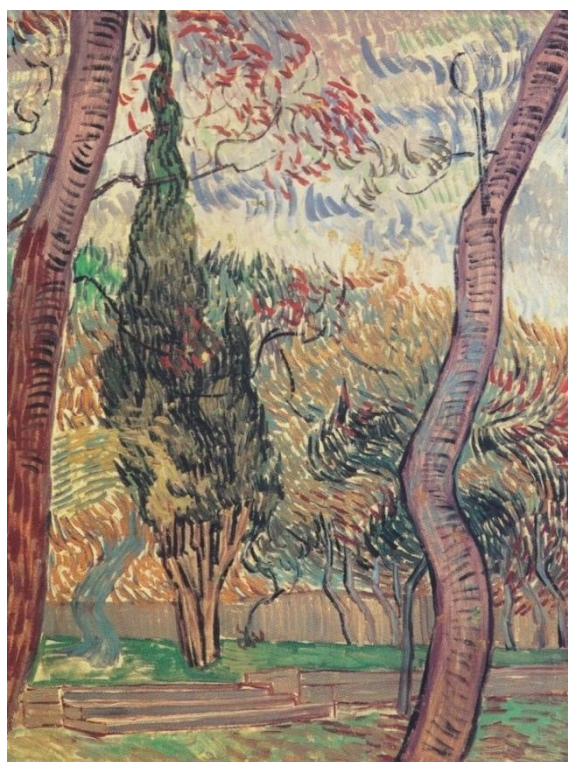
Figura 3. El jardín de Saint-Paul. Fuente: Van Gogh (1889).

No puede faltar con el comienzo del siglo XX en pleno Art Nouveau extendido en toda Europa El árbol de la vida (1909) de Gustav Klimt, pintor clave en el modernismo vienés, que busca una renovación artística alejada del mundo industrial cada vez más imperante. Esta obra conocida como friso Stoclet abarca metros de largo con figuras a cada lado del popular árbol curvilíneo que entrelaza tanto a la mujer de un lado como la pareja abrazada al otro. Las espirales de este árbol han transcendido a otros campos, y es uno de los árboles que más inspiran a millones de creadores hoy en día en el terreno del diseño, publicidad, interiorismo, etc.