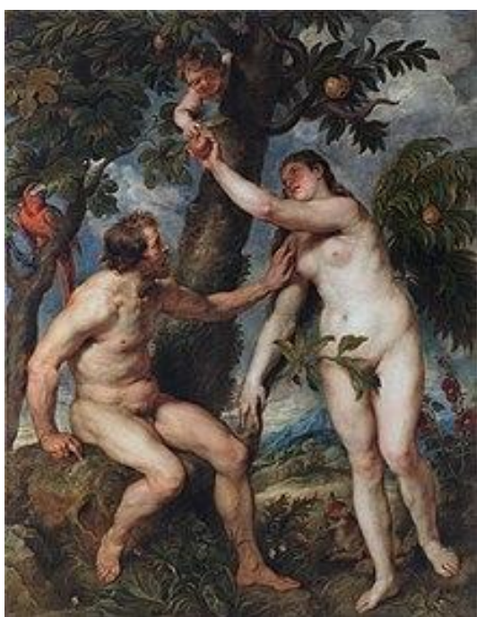
Figura 1. Adán y Eva. Fuente: Rubens (1620).

Se escoge La Alegoría del árbol de la vida (1653), realizado por el discípulo de Zurbarán, Ignacio de Ries, un óleo ideado para la capilla de la Concepción de la Catedral de Segovia situado dentro de un género que surge en el siglo XVII conocido como la pintura de vanitas (subgénero del bodegón o naturaleza muerta) que alude a la fugacidad de la vida en una efímera existencia acompañada de la muerte, presente para recordar esta idea. Un árbol frondoso y simbólico donde se celebra en su copa un banquete que recuerda el paso fugaz del tiempo puesto que la muerte casi ha cortado el árbol con su guadaña (Cabrejas, 2020).