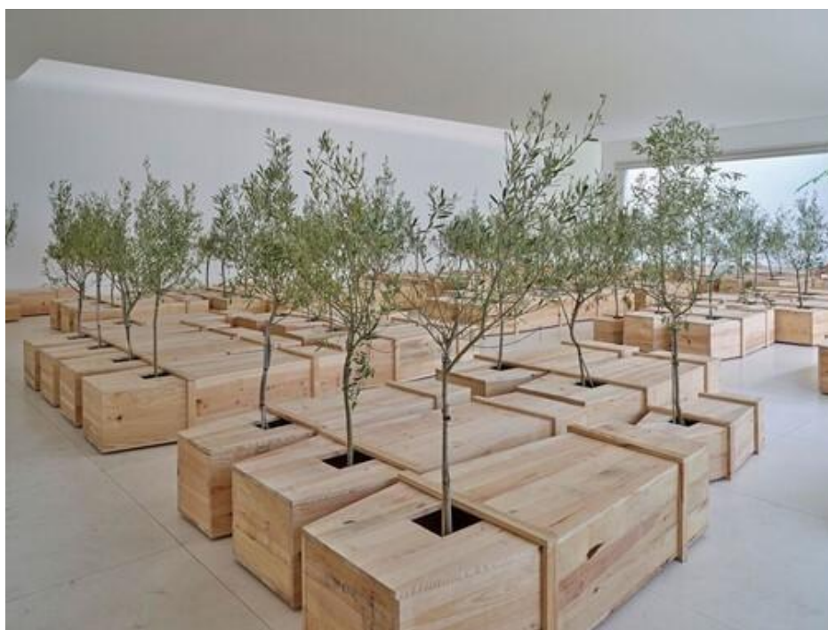
Figura 5. Ex it de Yoko Ono. Instalación de 2020.

Las instalaciones artísticas tienen conexión con el Land Art (arte de la tierra), cuya incorporación de la naturaleza y su transformación es su principal acción como recuerda El bosque de Oma en el País Vasco que en 1982 comenzó el artista Agustín Ibarrola. Vendrán otros, como el arte ecológico mucho más comprometido. En cuanto a activismo artístico destacamos a Beuys en la Documenta Kassel de 1982, todo un referente cuando a modo de performance arbórea plantó 7000 robles por cada una de las piedras que había frente al museo en esta feria de arte contemporáneo. Estas piedras que amontonó, solo se irían quitando mientras fuera plantando. Aunque Beuys falleció antes de acabar, lo continuaron sus seguidores hasta finalizarla y hoy en día crecen espléndidos (Astigueta, 2021, p. 72).