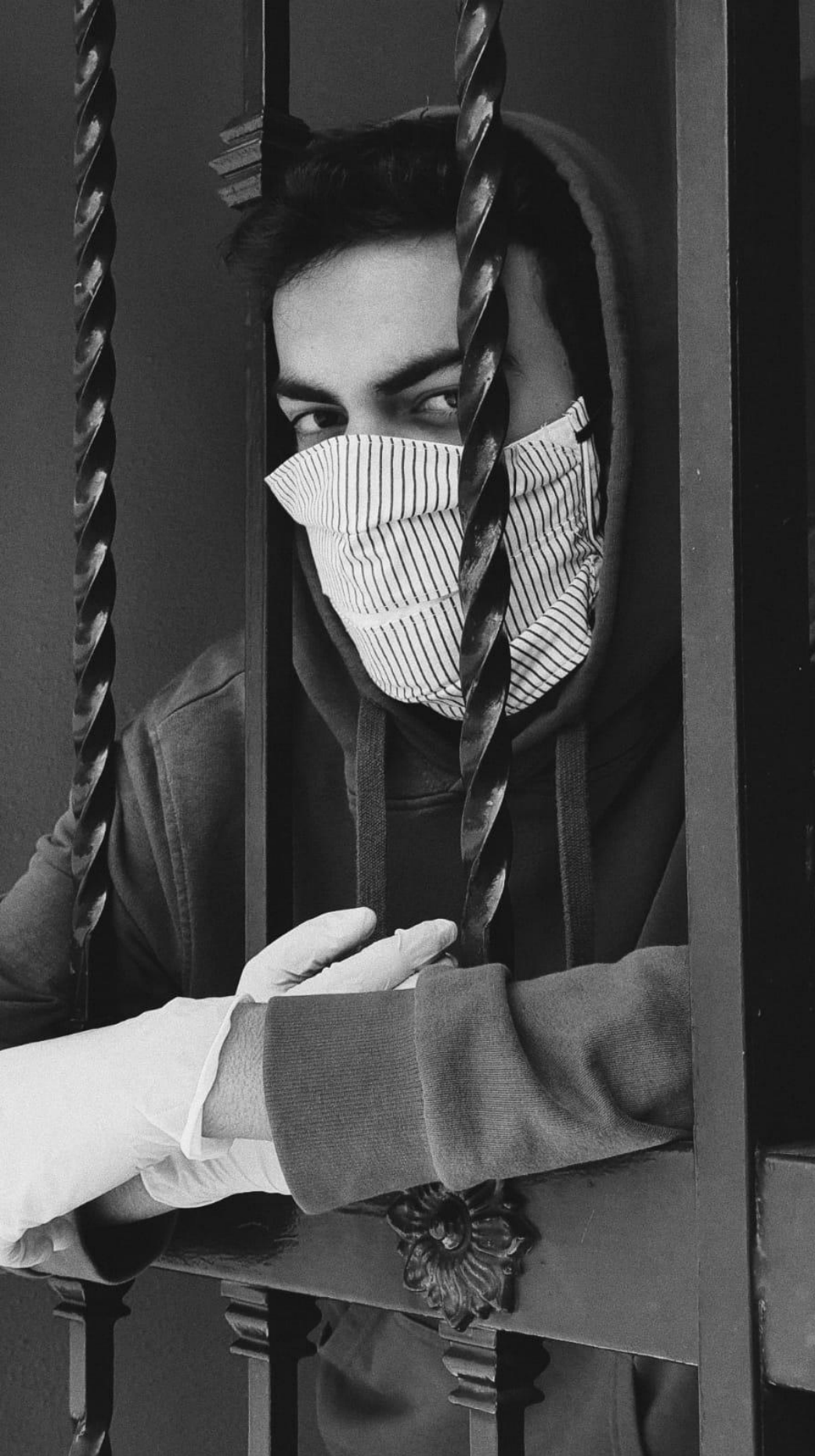
#PHEdesdemibalcón (2020). Alejandro García Rodríguez. Alumno del IES Heliche. Obra fotográfica licenciada bajo Creative Commons (BY-NC-SA) 4.0