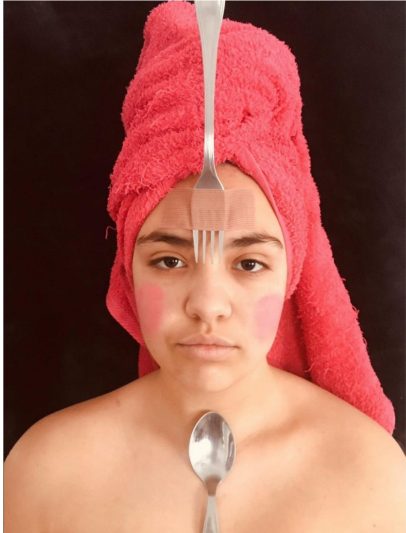
«Arte en la cuarentena» (2020). Paula Silva Ribera. Alumna del IES Heliche. Obra licenciada bajo Creative Commons (BY-NC-SA) 4.0. Reinterpretación de la obra "Fork" (2), de Afarin Sajedi.