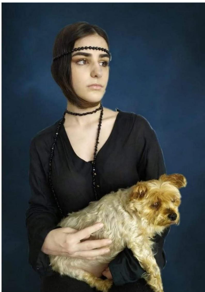
«Arte en la cuarentena» (2020). María Riego Romero. Alumna del IES Heliche. Obra licenciada bajo Creative Commons (BY-NC-SA) 4.0. Reinterpretación de la obra "La dama del armiño" (1490), de Leonardo da Vinci.