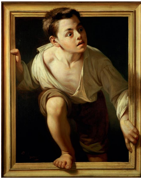
«Arte en la cuarentena» (2020). Esteban Torres Gutiérrez. Alumno del IES Heliche. Obra licenciada bajo Creative Commons (BY-NC- SA) 4.0. Reinterpretación de la obra "Huyendo de la crítica" (1874), de Pere Borrell del Caso.