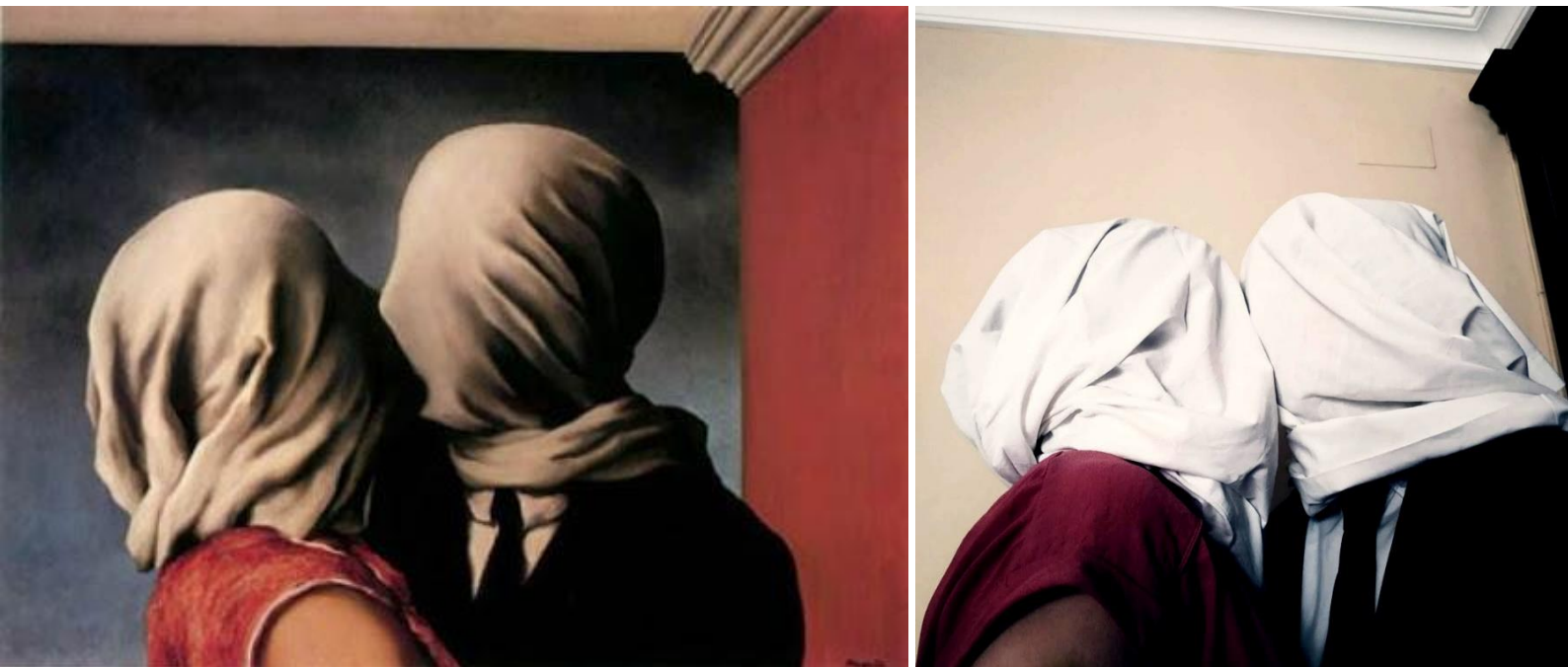
«Arte en la cuarentena» (2020). Antonio Calero Ceas. Alumno del IES Heliche. Obra licenciada bajo Creative Commons (BY-NC-SA) 4.0. Reinterpretación de la obra "Los amantes" (1928), de René Magritte.