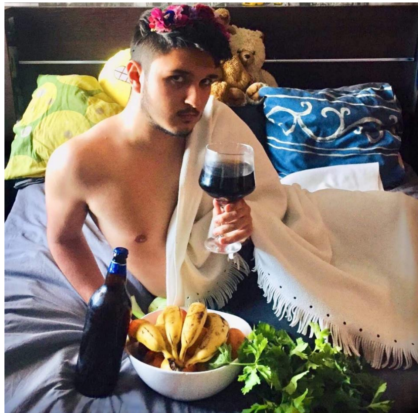
«Arte en la cuarentena» (2020). Naim Real Garrido. Alumno del IES Heliche. Obra licenciada bajo Creative Commons (BY-NC-SA) 4.0. Reinterpretación de la obra "Baco" (1598), de Caravaggio.