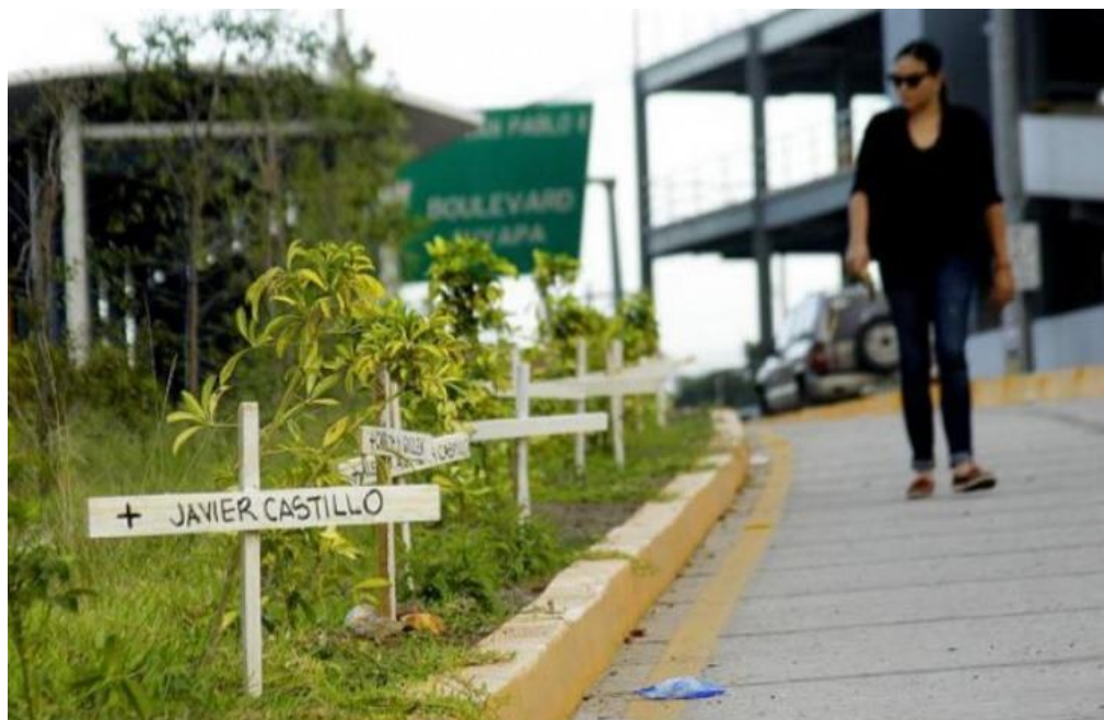
Figura 3. Regreso a las seis , de Nora Buchanan. (Trans 450, Tegucigalpa, 2014).