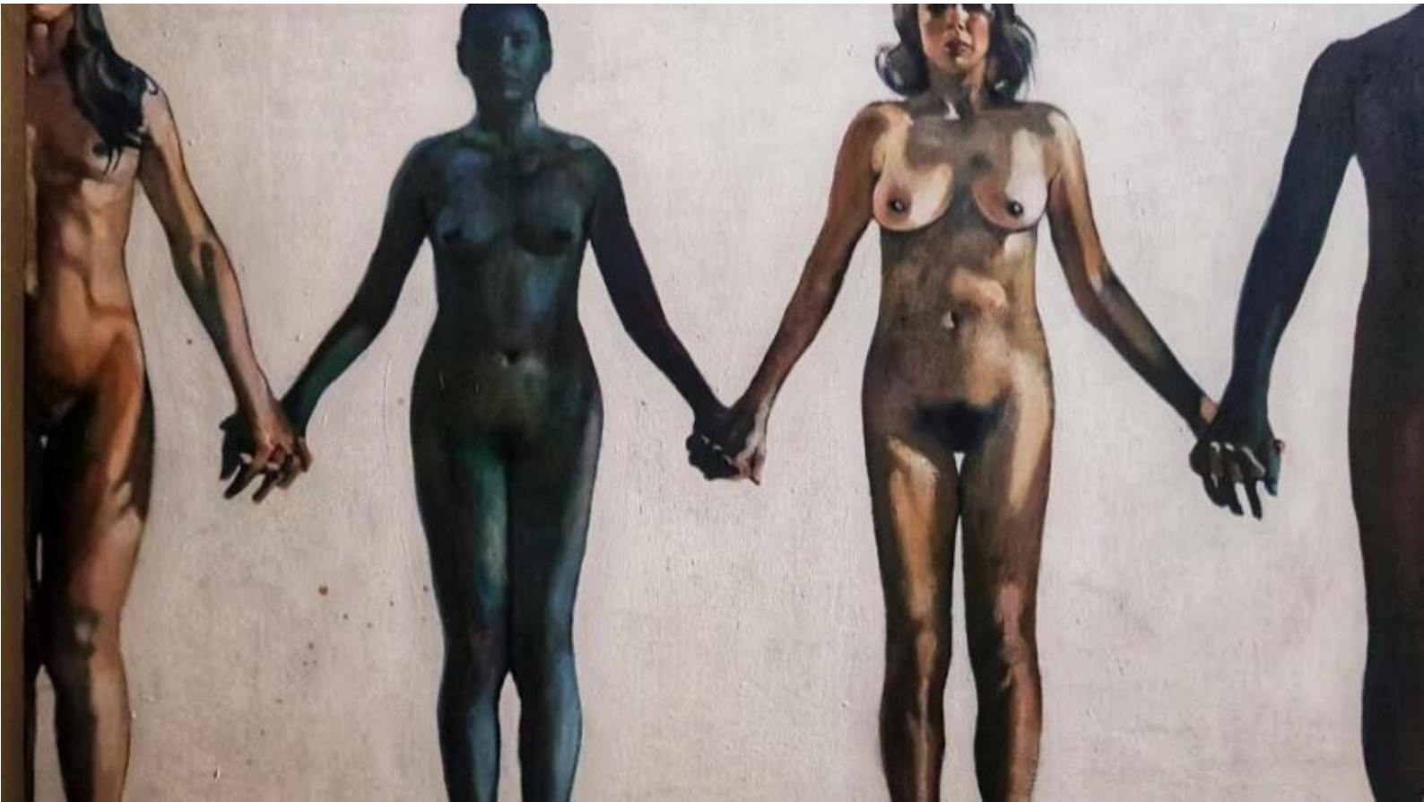
Figura 8. Perdidos pero tomados de la mano , de Lidia Cáliz. [Fotografía de Lidia Cáliz]. (Tegucigalpa, 2005). Archivos fotográficos propios.

Otros artistas contemporáneos que intervienen en espacios públicos son: