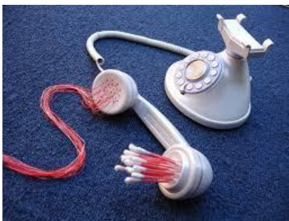
Figura 7. [Fotografía de Adán Vallecillo]. (Tegucigalpa, 2005). Archivos fotográficos del autor. Asepsiófono , de Adán Vallecillo.