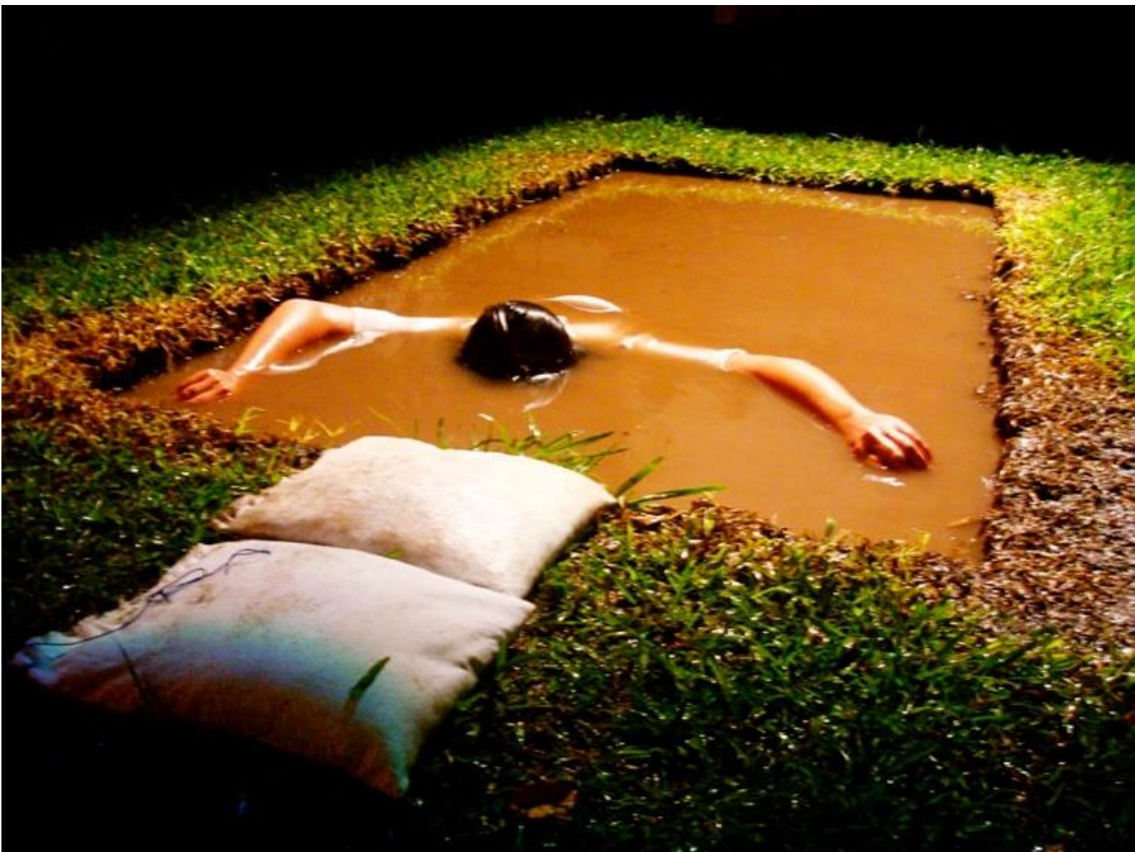
Figura 5. Alegoría de un país que no pudo ser , de Jorge Oquelí. (Galería Nacional de Arte, Tegucigalpa, 2010). De la colección de la III bienal de Honduras.