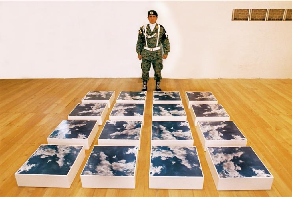
Figura 1. Nubes para ser resguardadas , de Gabriel Galeano. [Fotografía de Gabriel Galeano]. ( Mujeres Unidas en las Artes , Honduras 2009). Archivos fotográficos del autor.