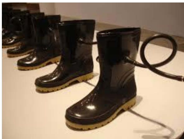
Figura 6. Autopoiesis I , de Adán Vallecillo. (Museo para la Identidad Nacional, Tegucigalpa, 2008).