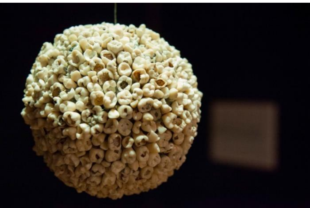
Figura 2. Alboroto , de Adán Vallecillo. (Museo para la Identidad Nacional, Tegucigalpa, 2015).