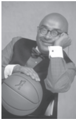
Figura 3. Andrés Montes, fotografía promocional en su etapa en Digital + 3

La noticia de su fallecimiento apareció en algunos medios digitales (como Elpaís.com, Marca.com o Elmundo.es) el viernes 16 de octubre de 2009 de la siguiente manera: por un lado, Elmundo.es tituló “Hallan muerto en su domicilio al locutor y periodista Andrés Montes” (Durán y Ruiz, 2009) y en el texto añadió que “cuando la policía llegó al número 31 de la calle Espronceda, yacía sobre la cama vestido con un pijama y la almohada se encontraba manchada de sangre. Precisamente ese rastro de sangre provocó que hasta allí se desplazara una unidad de homicidios, pero las primeras investigaciones indican que el cuerpo no presentaba signos externos de violencia”. Un día después Elmundo.es añade otro dato que parece indicar que se trata de un suicidio: “Un sobrino de Montes avisó a la policía cuando descubrió el cadáver y a la pareja del periodista, que, en estado de shock, repetía: Yo también me quiero matar” (Elmundo.es, 2009b).