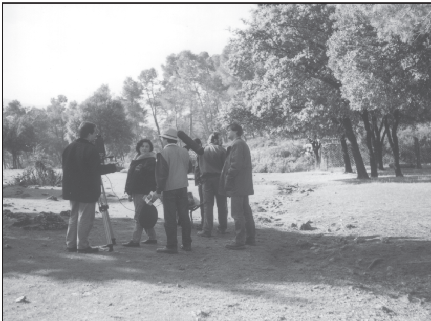
Un equipo de Tierra y Mar durante la grabación de un reportaje sobre la berrea del ciervo en el Parque Natural de Cazorla, Segura y las Villas (Jaén), en septiembre de 1996.