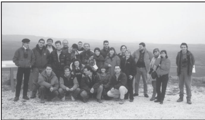
Periodistas especializados en medio ambiente de España durante unas jornadas organizadas por la Sociedad Española de Ornitología en Gallocanta, Zaragoza, en febrero de 1998. Una gran parte de los periodistas pertenecen a la Asociación de Periodistas de Información Ambiental de España. En estas jornadas participó un equipo de Canal Sur Televisión.