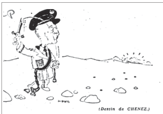
Fig. 2. Viñeta en Le Monde , 22 de octubre de 1975, p. 2

La segunda resulta muy reveladora con respecto a la ambigüedad de la política que España mantendría en el Sahara, pues muestra un Franco muy envejecido en el desierto, vestido con un uniforme que le queda enorme y desenvainando una espada rota 39 .