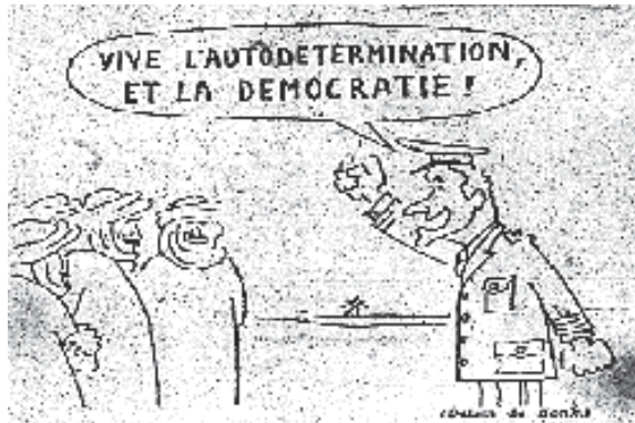
Fig. 3. Viñeta en Le Monde , 4 de noviembre de 1975, p. 1

La tercera hace referencia a la visita de don Juan Carlos al Sahara a principios de noviembre de 1975 y en ella aparece vestido de uniforme en el desierto frente a varios saharauis sonrientes. De su boca sale un bocadillo que reza “Vive l'autodetermination et la démocratie” 40 .