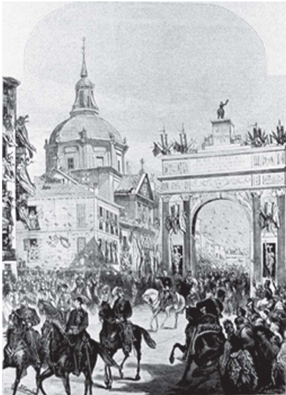
2. Entrada del Rey en Madrid (14 del actual). Ovación al pasar S.M. por el arco del triunfo levantado en la calle de Alcalá. La Ilustración Española y Americana, 15.01.1875