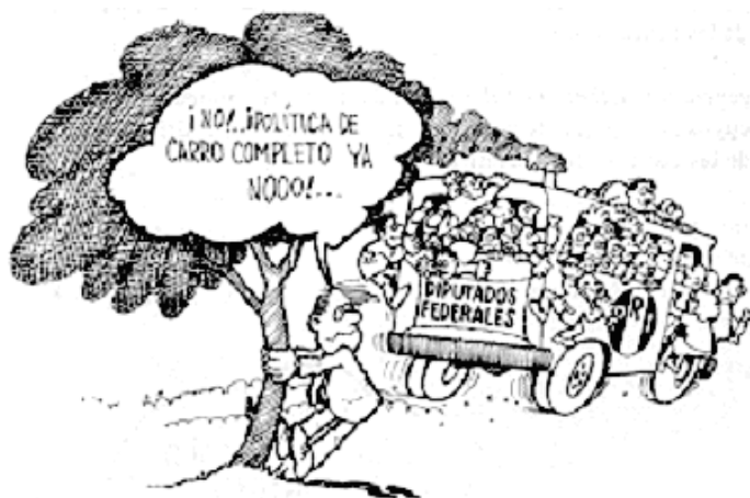
Ilustración de José Duarte en Prawda , 1987.

A pesar de todo lo anterior, López Portillo necesitaba no dejar de voltear al pueblo y en este sentido inició la reforma política que permitió por primera vez en el país (en 1982 al término de su mandato) que contendieran a la silla presidencial nueve partidos y siete candidatos. De cualquier forma el sistema no estaba dispuesto a moverse un ápice para repartir el poder, la sombra del fraude electoral apareció y el PRI ganó 299 de los 300 distritos electorales.