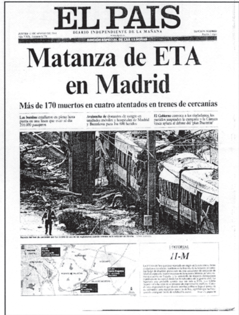
Portada del diario El Mundo y El País del 11-M

Reinhard Gäde sostiene que “para separar o agrupar bloques cabe igualmente alterar el ancho de las columnas del texto continuo o, antes que abusar de filetes y recuadros, aumentar los blancos que las separan” “... El blanco es un elemento configurativo y ordenador de primer orden; no existe mejor recurso que él para guiar el ojo del lector sin imitaciones” 3 .