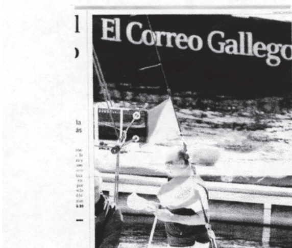
Don Juan Carlos, en el panteón del puerto deportivo. Tras él, el velero de SSG-El Correo Gallego