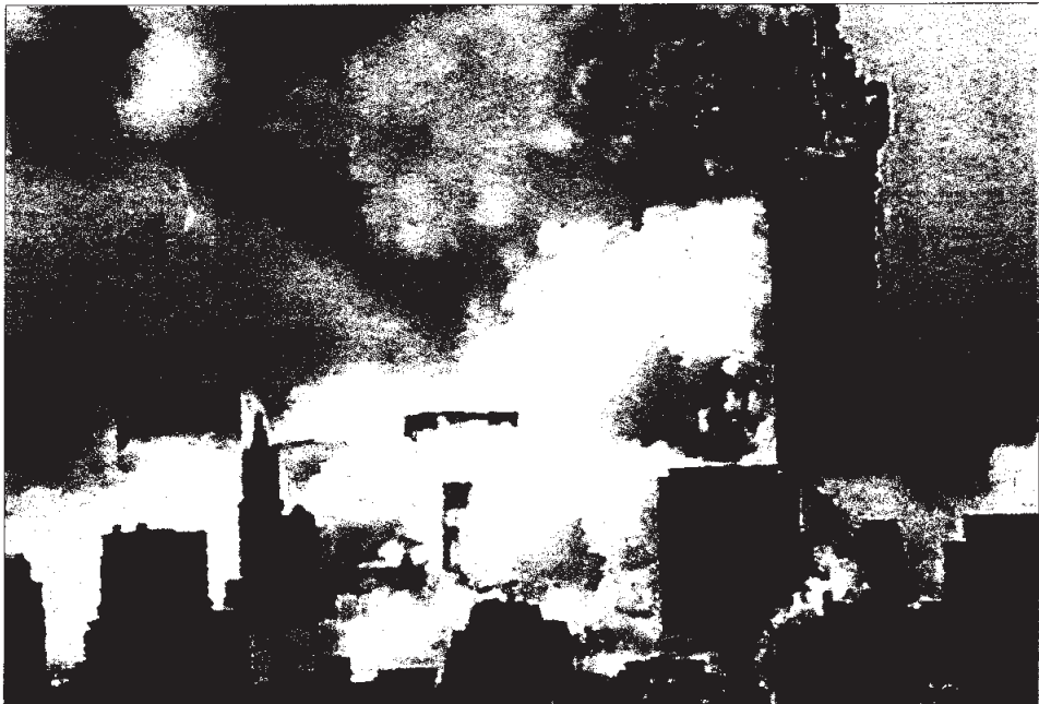
Momento en el que se cae una de las dos Torres Gemelas de Nueva York. Posteriormente, se desplomó también la segunda a consecuencia de los ataques aéreos.