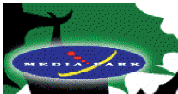
Logotipo de Media Park

Como acabamos de reseñar, Canal Natura está producido por Media Park, un centro de convergencia multimedia que abarca los diferentes ámbitos que componen la nueva sociedad de la información, desde la televisión convencional y la televisión digital temática a la creación de aplicaciones multimedia y servicios interactivos, pasando por proyectos de información y comunicación global. Los accionistas de Media Park 4 , ubicada en Sant Just Desvern, (Barcelona), son: Antena 3, Corporació Catalana de Radio y Televisió, Grupo Equip, Philips e Iberdrola. En este primer accionariado podemos observar la presencia de empresas del mundo de la comunicación, la tecnología de las comunicaciones y la gestión de recursos hídricos, sin duda uno de los campos donde se producen más conflictos ambientales.