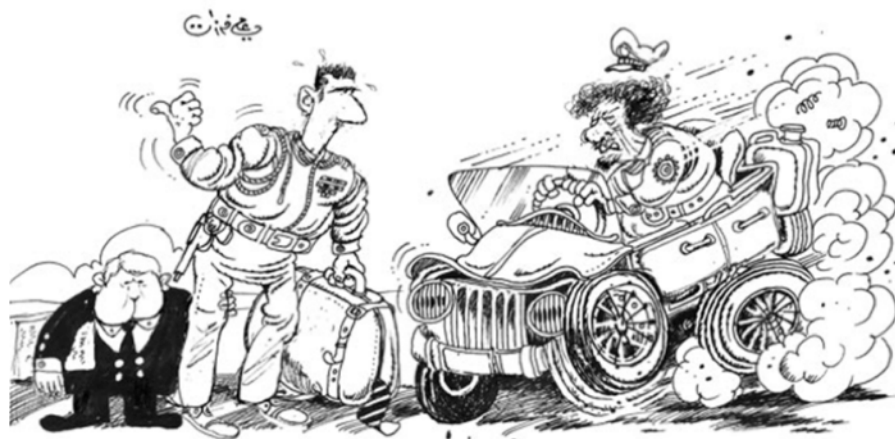
Figura 7: Bashar al-Asad y Gadafi tratando de escapar juntos (Ferzat, n. d.).

Con todo, la popularidad de Ali Ferzat aumentó considerablemente, hasta el punto de obtener el Premio Sajarov 9 a la Libertad de Conciencia en 2011 (Anónimo, 2011) y muchos caricaturistas se solidarizaron con él, publicando dibujos y haciendo exposiciones en su honor (Taher, 2011). Por ello, esta acción mostró que el miedo se había acabado y que nadie podía pararlos porque habían desarrollado un arte de resistencia. Entonces, la caricatura se había consolidado y se había convertido en un arma de lucha pacífica y en un símbolo en sí mismo capaz de movilizar a la sociedad contra el presidente sirio (Anónimo, 2013, 20 de agosto). Asimismo, se transformó en un signo de libertad que aparecía en las manifestaciones que se desarrollaron en Siria durante la Primavera Árabe (Anónimo, 2015, 28 de enero).