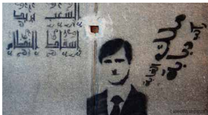
Figura 4: El pueblo quiere que caiga el régimen (Suzee, 2011) 5 .

Asimismo, este arte se extendió en otros países. Es cierto que el arte del grafiti se desarrolló en todos los países en los que se produjo la Primavera Árabe, pero el caso de Siria fue un tanto especial, ya que se realizaron murales como signo de solidaridad, dado que la Primavera Árabe acabó desembocando en una guerra civil. De este modo, fue muy normal encontrar grafitis en países como Egipto, Líbano o Palestina que pedían la dimisión del presidente al-Asad, así como el cese de la guerra