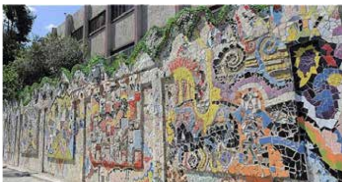
Figura 3: Mural que entró en el libro Guinness de los Récords (EFE, 2014).

Asimismo, este arte se extendió en otros países. Es cierto que el arte del grafiti se desarrolló en todos los países en los que se produjo la Primavera Árabe, pero el caso de Siria fue un tanto especial, ya que se realizaron murales como signo de solidaridad, dado que la Primavera Árabe acabó desembocando en una guerra civil. De este modo, fue muy normal encontrar grafitis en países como Egipto, Líbano o Palestina que pedían la dimisión del presidente al-Asad, así como el cese de la guerra