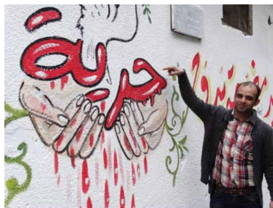
Figura 2: Libertad (FREEDOM GRAFFiTi WEEK Syria, 2015) 4

a controlar quién compraba los sprays y qué pretendía hacer con ellos (Alhames, 2013, 27 de enero).