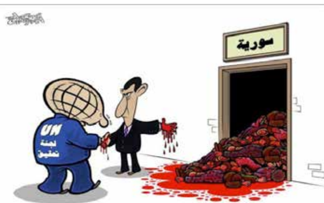
Figura 5: El pacto del presidente al-Asad y las Naciones Unidas (Cartoon Movement, 2015) 6 .

Estado, utilizando como prueba las caricaturas que había hecho para criticar al presidente sirio (Russell, 2013). Aun así, algunas fuentes cercanas al entorno del caricaturista comentaron que podría haber sido ejecutado en julio de 2013 cuando iba de camino a la cárcel, bajo las órdenes del Vicepresidente Adjunto de Asuntos de Seguridad en Siria (Cavna, 2013).