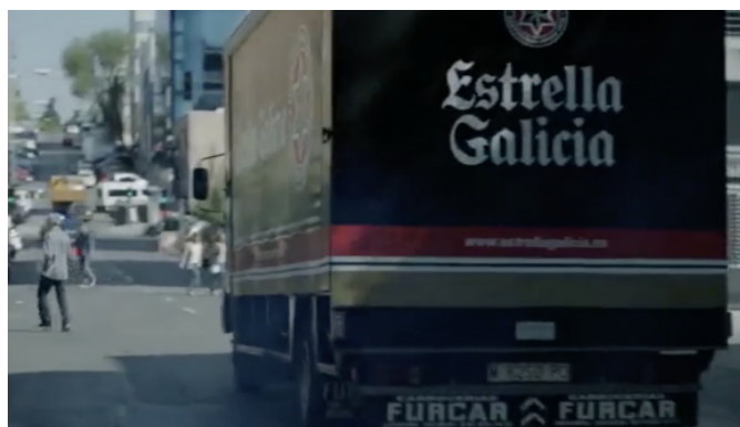
Figura 3. Brand placement de Estrella Galicia en capítulo sexto de la segunda temporada

También debemos hacer mención a uno de los emplazamientos determinantes de la marca, cuando en el final de la segunda temporada el camión de reparto de cerveza de Estrella Galicia se convierte en un elemento clave del atraco, ya que El Profesor y Helsinki huyen en él, tras haber metido el dinero en los bidones de cerveza que llevan en el camión. Puede verse este emplazamiento en la figura 3: