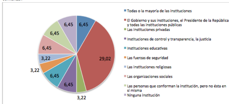
Gráfico 1: ¿De las instituciones que existen en el Ecuador, diga cuáles son las instituciones que le sugieren mayor confianza?

Fuente: Elaboración propia (datos expresados en %)