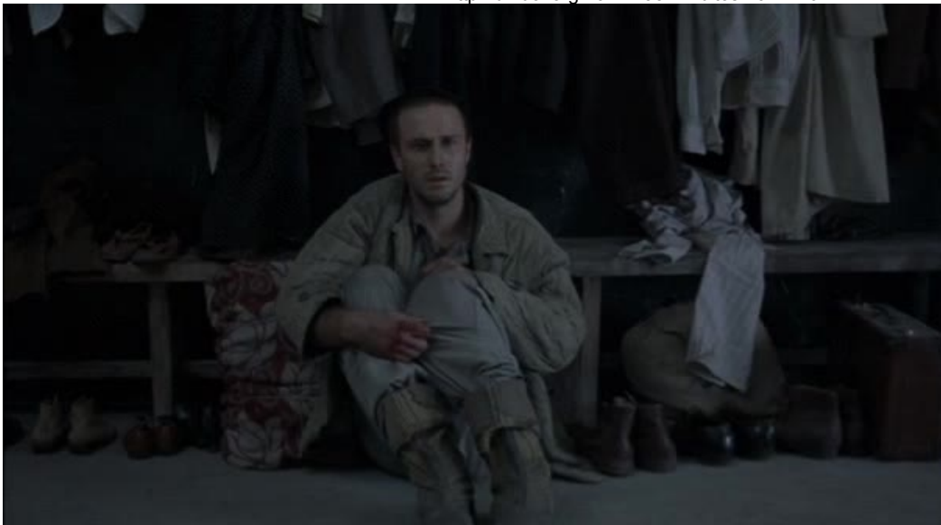
Imágenes 15 y 16: La zona gris (Tim Blake Nelson, 2001)