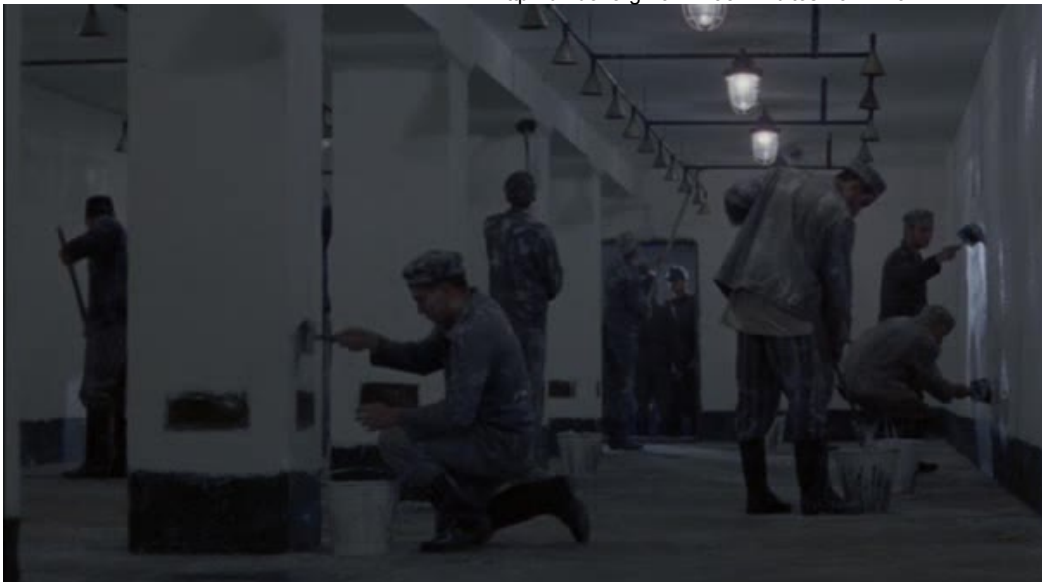
Imágenes 11 y 12: La zona gris (Tim Blake Nelson, 2001)

En primer lugar, la secuencia está completamente desgajada en términos narrativos. No comparece ningún protagonista, ni tiene lugar ningún acontecimiento que haga avanzar la acción. Antes bien, su significado es puramente descriptivo de cara al espectador: nos habla de un proceso , de la elaboración de un cierto trabajo. Los planos están conectados por una suerte de lógica apoyada en el tiempo: mientras se limpian las paredes (panorámica), arden los cadáveres (panorámica), y finalmente (salto de eje óptico) el habitáculo se prepara para una nueva recepción de futuras víctimas.