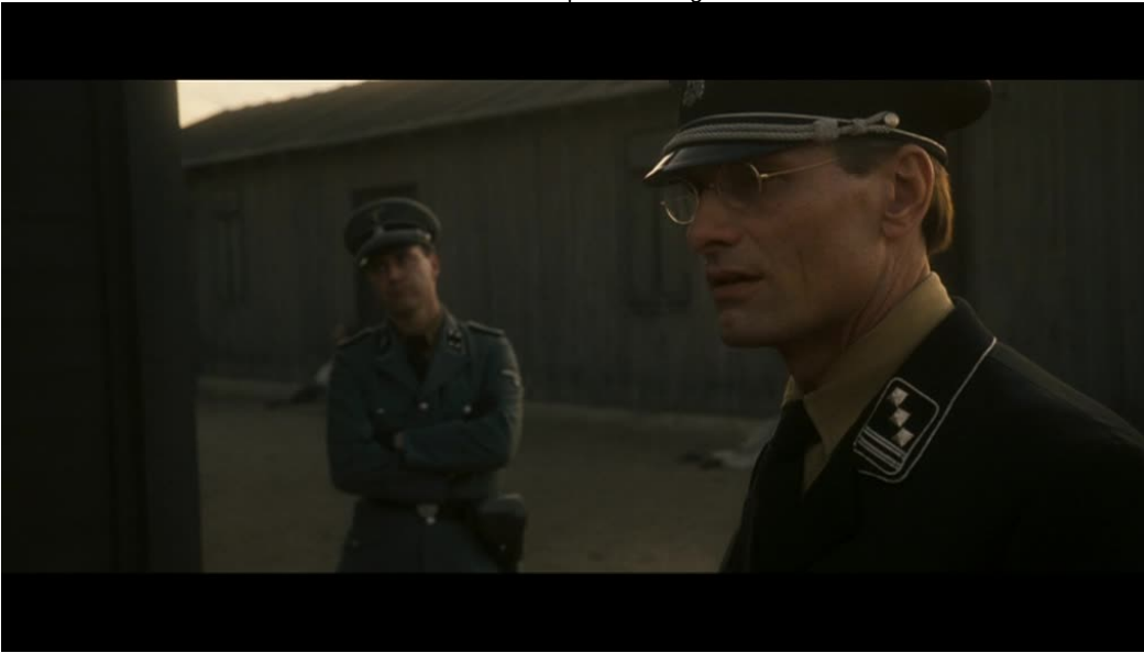
Imágenes 03 y 04: Good (Vicente Amorin, 2008)

Mortensen pronuncia entonces las dos últimas palabras de la película: Es real . Ahora bien, ¿qué es real ? ¿El delirio que atenazaba al personaje y que ahora se encarna en esos cuerpos que miran hacia él? ¿El sistema de exterminio, consecuencia última de sus teorías académicas que ahora se encarnan en la topografía del campo? O en el límite, ¿el propio sistema fílmico enunciativo, en el que no hay corte alguno sino que el tiempo –un tiempo del horror- fluye interminablemente dentro del plano?