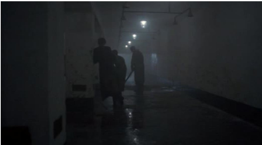
Imágenes 07 y 08: La zona gris (Tim Blake Nelson, 2001)

El corte en montaje se produce inmediatamente a continuación, con una panorámica descendente que acude a la contra del movimiento del humo que se alza hacia el cielo de Birkenau.