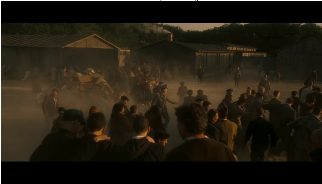
Imágenes 05 y 06: Good (Vicente Amorin, 2008)

El plano secuencia es utilizado, por tanto, no tanto como una garantía de verdad, sino como una posibilidad de traducir en un flujo de tiempo cinematográfico la idea del descubrimiento y el cierre hermenéutico que atraviesa el triángulo de protagonistas propuesto por Raul Hilberg (1993): del bystander –representado en la figura de un Mortensen que, simplemente, no quiso ver- a la víctima, atravesado a su vez por la presencia del verdugo. La anagnórisis tiene forma, para Amorin, de recurso cinematográfico, de desplazamiento topográfico en el que la cámara atraviesa –guidada por el cuerpo o por la mirada del protagonista- la avenida principal del campo. En última instancia, el plano secuencia permite además generar dos interesantes fricciones en la focalización. La primera, cuando se genera una confusión entre la mirada de Mortensen y la del propio espectador en ese falso subjetivo, la segunda cuando la cámara se eleva por encima de la línea de visión humana y se posiciona en un picado ligeramente superior que coincide con una entidad casi teológica, o en el límite, con la propia presencia del enunciador clausurando el relato.