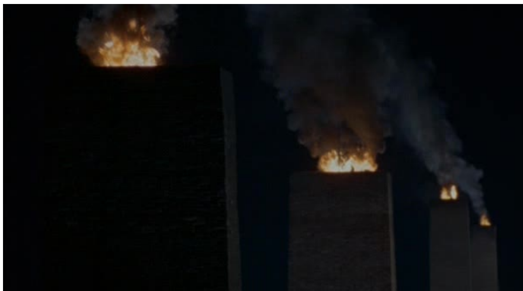
Imágenes 09 y 10: La zona gris (Tim Blake Nelson, 2001)

A continuación, regresamos de nuevo al interior de la cámara de gas. En esta ocasión, los sonderkommando pintan de blanco sus paredes ante la atenta mirada de un SS que fuma un cigarrillo al fondo de la escena. Se produce un salto sobre el eje óptico de alejamiento y el cuadro de los trabajadores se amplía considerablemente, generando una suerte de tableau macabro.