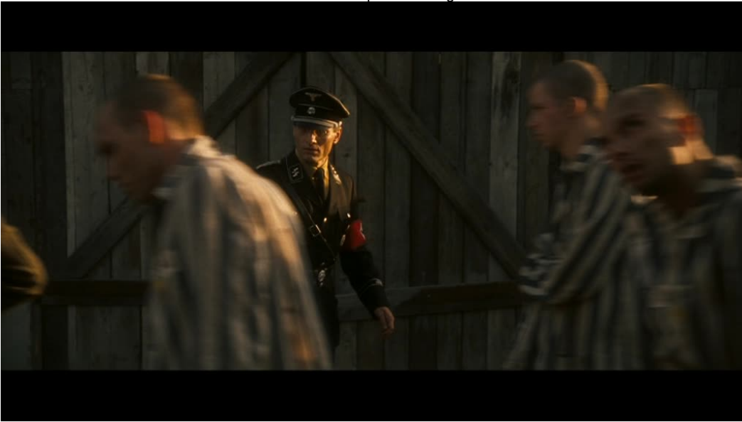
Imágenes 01 y 02: Good (Vicente Amorin, 2008)

En el segundo segmento, Amorin se separa del protagonista para mostrar los primeros –y únicos- rostros de las víctimas que comparecen frente al objetivo de la cámara: los músicos que tocan en la plaza principal del campo. A juzgar por su señalética, la mayoría de ellos son presos políticos, y no judíos, que miran al protagonista con una suerte de expresión confusa. La música sirve como un elemento distanciador, y al mismo tiempo, hilvana una serie de sugerencias con respecto a la psicosis que el director había esbozado en el metraje anterior –una alucinación que acompaña a Mortensen en su desplome. El plano secuencia se convierte, durante algunos segundos, en plano subjetivo al recorrer un arco que coincide con el eje de la mirada del protagonista. Sin embargo, antes de que el espectador se pueda instalar en dicha situación, volvemos en un nuevo movimiento a lo que correspondería con el contraplano de la banda.