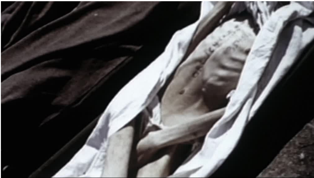
Imágenes 19 y 20: Auschwitz (Uwe Boll, 2011)

Al margen de los muchos problemas históricos y ontológicos que plantea la definición de Boll o, como ya hemos visto, la pura dificultad de definir “qué es Auschwitz”, a nivel de montaje hay un hecho que desmonta por completo su introducción: las imágenes insertadas no pertenecen a las bobinas rodadas por los soviéticos en la liberación de los campos. De hecho, las escasas imágenes que tenemos del interior de Auschwitz después de la liberación son, en su gran mayoría, imágenes propagandísticas, modificadas a su conveniencia por distintos técnicos del ejército rojo (7), que por lo demás, no corresponden a las utilizadas por Boll.