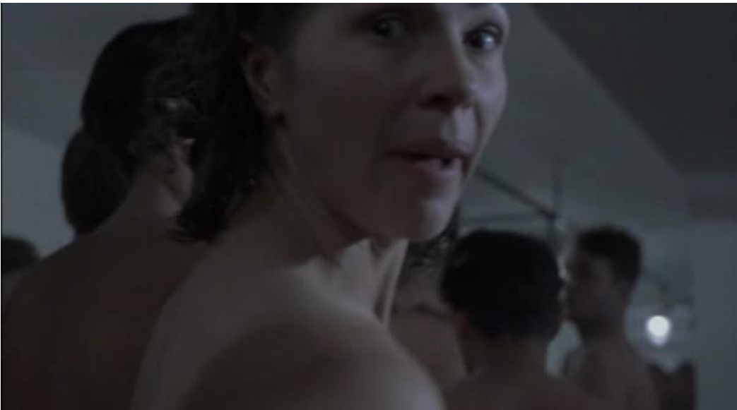
Imágenes 13 y 14: La zona gris (Tim Blake Nelson, 2001)

El montaje volverá a dejar de nuevo fuera del relato la mostración explícita de lo que ocurre con los cuerpos en el interior de la cámara. En su lugar, ofrece dos planos sustitutorios: un rápido inserto de la puerta al ser cerrada y una panorámica de acercamiento al cuerpo atormentado de Hoffman, utilizando únicamente el sonido para sugerir lo que ocurre en su interior: gritos, golpes sobre las paredes, y el constante zumbido de los crematorios filtrándose en el espacio.