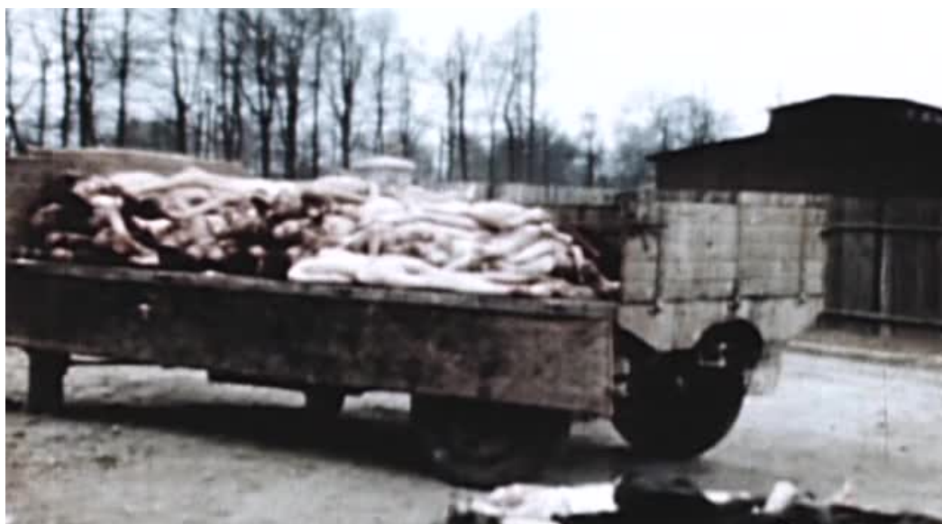
Imágenes 17 y 18: Auschwitz (UweBoll, 2011)

El discurso de Boll se levanta, como ya hemos dicho, en dos lenguas: el alemán y el inglés. Cada vez que el director cambia de lenguaje, se introduce uno de esos planos de archivo. Resulta interesante que toda la presentación se genere sobre esa incomodidad de la lengua, ese doblez del lenguaje en el que comparecen tanto el lenguaje en el que se perpetra el crimen (Klemperer, 2001) como el lenguaje hegemónico en el momento del rodaje. Lo que más nos interesa ahora, sin duda, es la extraña función de “separador” en la que Boll utiliza las imágenes de archivo. Hay dos efectos inmediatos en su posición: el primero es el de “cita” o “referencia” a la parte más extrema de un imaginario icónico de nuestra Historia reciente: conocemos esas imágenes –las pilas de cadáveres, los camiones cargados, los rostros esqueléticos- y se han convertido en parte integrante de nuestro universo icónico. Son, por lo tanto, un elemento que pese a su contenido siniestro, ya ha sido integrado en nuestro paisaje icónico (Zemel, 2003; Bohm-Duchen, 2003). Del mismo modo, y en un segundo nivel, la inserción de dichas imágenes funciona como una garantía de verdad, un elemento que inviste de autoridad las palabras de Boll en tanto las atraviesa en el montaje. El cadáver comparece, silencioso, allí donde el director proclama, de manera explícita y de manera comparativa, el grado de verdad que pretende conseguir en su representación.